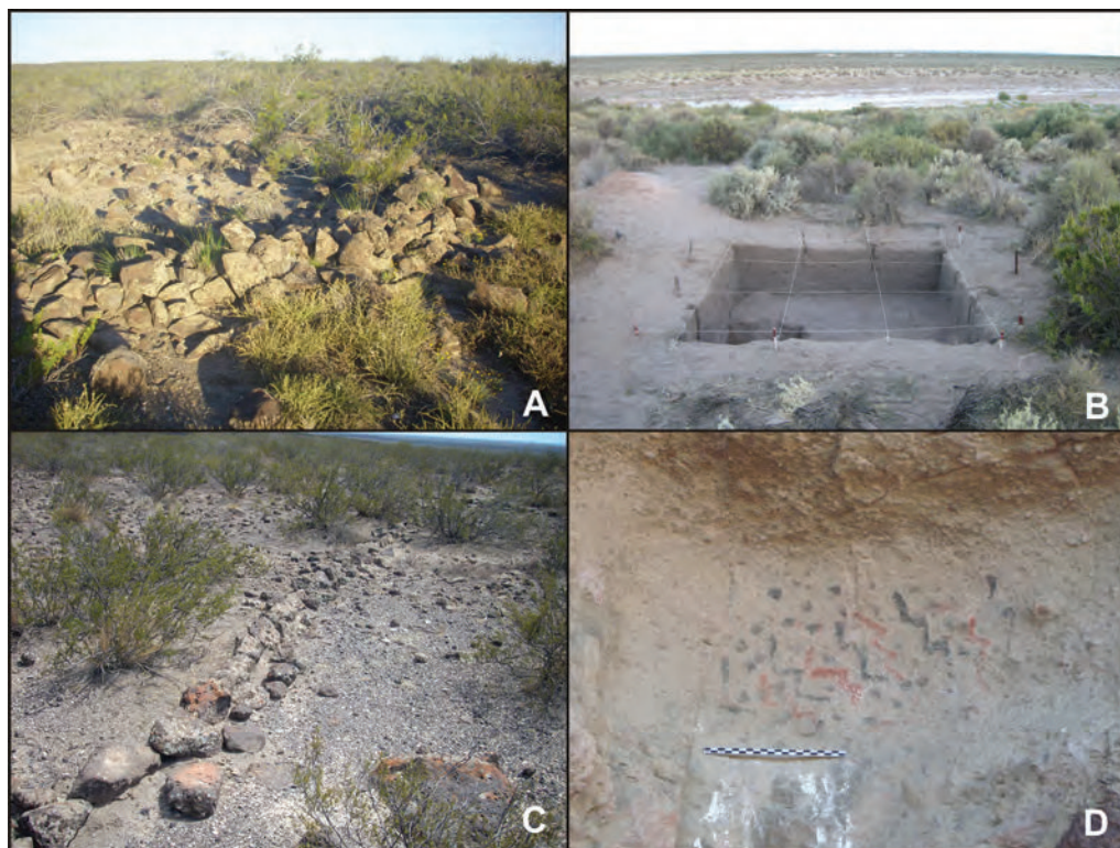
Figura 3. Distintos tipos de sitios arqueológicos: (A) recintos de piedra posiblemente residenciales (Recintos de Aguada); (B) sitios superficiales sobre médanos asociados a manantiales (Trapalcó 1); (C) estructuras de piedra no asociadas con ocupaciones residenciales (Recintos de Aguada); (D) sitios con arte rupestre (Rinconada Catriel)

y Tembrao), cerca de los arroyos, o bien en la línea de bajos sin salida (como Trapalcó 1 y 2, Menuco del Salitral y Puesto Mansilla), cerca de los manantiales. La mayor parte de esos sitios (sin estructuras de piedra) se encuentra sobre depósitos eólicos, principalmente médanos (figura 3b). Aunque aún no se relevaron intensivamente las extensas áreas de planicies ubicadas al norte y al sur de la línea de bajos, hasta el momento no se registraron allí sitios arqueológicos.