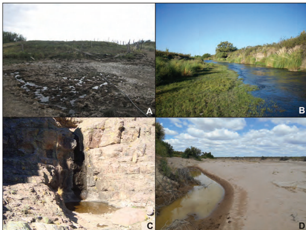
Figura 2. Fuentes de agua dulce superficial en el área de estudio: (A) manantial con una formación de tipo menuco en el surgente; (B) curso superior del arroyo Valcheta; (C) ojo de agua en las Sierras de Pailemán; (D) reservorio de agua en el interior de un cañadón que desemboca en el bajo de Trapalcó

terísticas geográficas (González Díaz y Malagnino 1984; Fontana 2001). Una vez seleccionadas las áreas por relevar, y habiendo obtenido la información de los referentes locales, se realizó un reconocimiento general en las siguientes unidades ambientales: bajos de Trapalcó y Santa Rosa, planicies y valles al pie de Somuncurá y Sierras de Pailemán. En las áreas relevadas se realizaron descripciones exhaustivas en el campo, prestando especial atención a la distribución y ubicación de materiales arqueológicos y a las características de las fuentes de agua disponibles. Se tomaron muestras de materiales superficiales y, en los casos con potencial para la presencia de materiales enterrados, se realizaron sondeos estratigráficos de 50 x 50 cm. En tres sitios se efectuaron pequeñas excavaciones cuya descripción no es objetivo de este trabajo. Para obtener información cronológica general se obtuvieron fechados de muestras de varios de los sitios relevados.