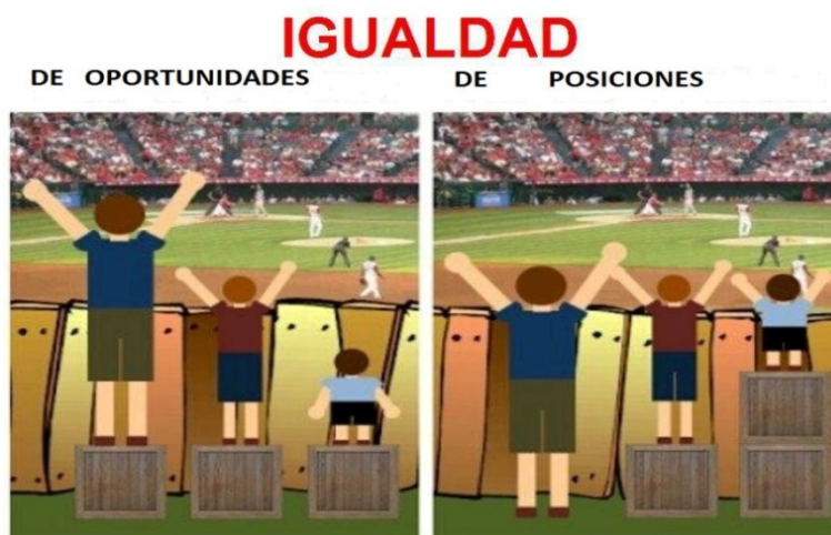
Figura 1: Igualdad de Oportunidades vs. de posiciones

nes (y no a la igualdad de oportunidades) como una alternativa a ser priorizada por los responsables de la acción política. Para entenderlo mejor, sería algo así: