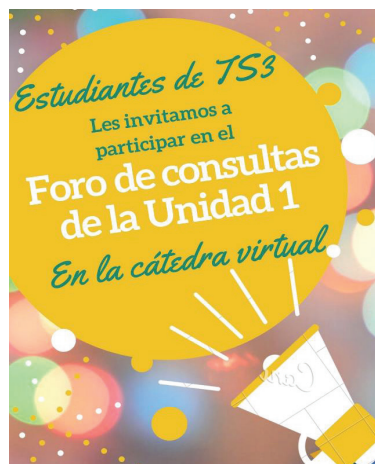
Ilustración 2 (Elaboración equipo de cátedra)

Luego de iniciar el cursado, las/os estudiantes han completado un Formulario Google que elaboramos desde el equipo, para conformar un listado provisorio de la cohorte 2020, ya que aún no contamos con listados oficiales, dado que se postergó en la facultad la reinscripción anual y a materias, habiendo finalizado el 8 de mayo. Además, a través del formulario mencionado, relevamos algunos datos de conectividad y disponibilidad de dispositivos del estudiantado.