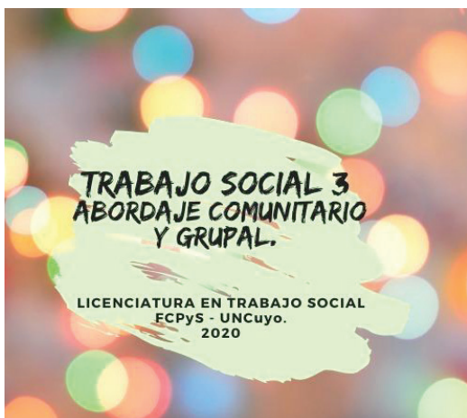
Ilustración 1 (Elaboración equipo de cátedra)

Compartimos a continuación algunas imágenes que elaboramos desde el equipo de cátedra, previo al inicio del cursado, y que difundimos en distintos espacios y medios (plataforma Uncuvirtual, grupo cerrado de Facebook en donde se empezó a agregar estudiantes, e Instagram):