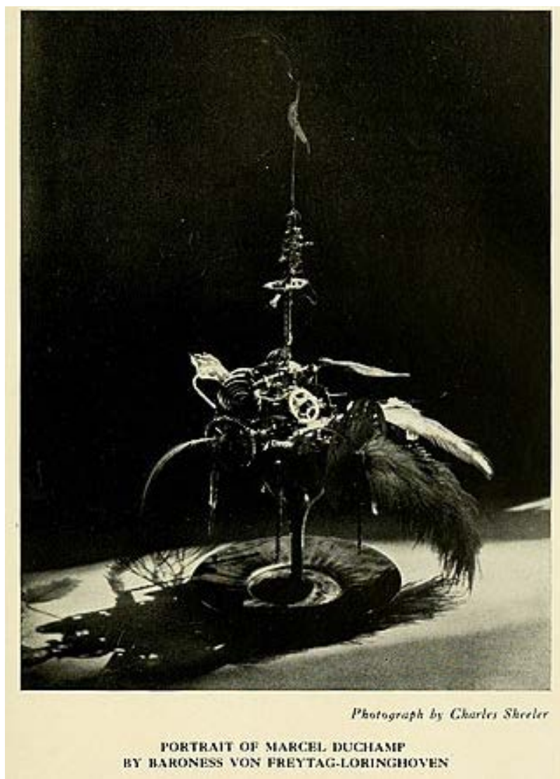
Figura 4. Retrato de Marcel Duchamp (ca. 1919-1922), obra de la baronesa Elsa von Freytag-Loringhoven

como «WC», que acostumbraba a vestirse de hombre y a firmar sus poemas con seudónimos masculinos, que «R. Mutt» pudiera relacionarse con los vocablos alemanes armut ('pobreza') o urmutter ('gran madre o madre tierra'), juegos de palabras habituales en su obra poética y directamente relacionados con su biografía: su madre, dos años antes de morir de cáncer uterino, fue ingresada a una institución psiquiátrica, de lo que Freytag-Loringhoven siempre culpó a su padre, un hombre violento y abusivo.