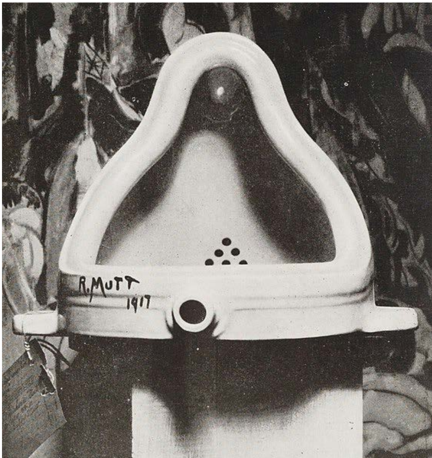
Figura 1. El urinario original, fotografiado por Alfred Stieglitz en 1917, después de su rechazo por la Sociedad de Artistas Independientes

La fuente , como se conoció luego la obra, fue trasladada a la Galería de Arte 291, propiedad del fotógrafo y amigo de Duchamp, Alfred Stieglitz, donde se instaló al revés sobre un plinto y fue fotografiada por el propio Stieglitz. Posteriormente, el urinario desapareció para siempre, y es esta la única foto que se conserva del original [Figura 1].