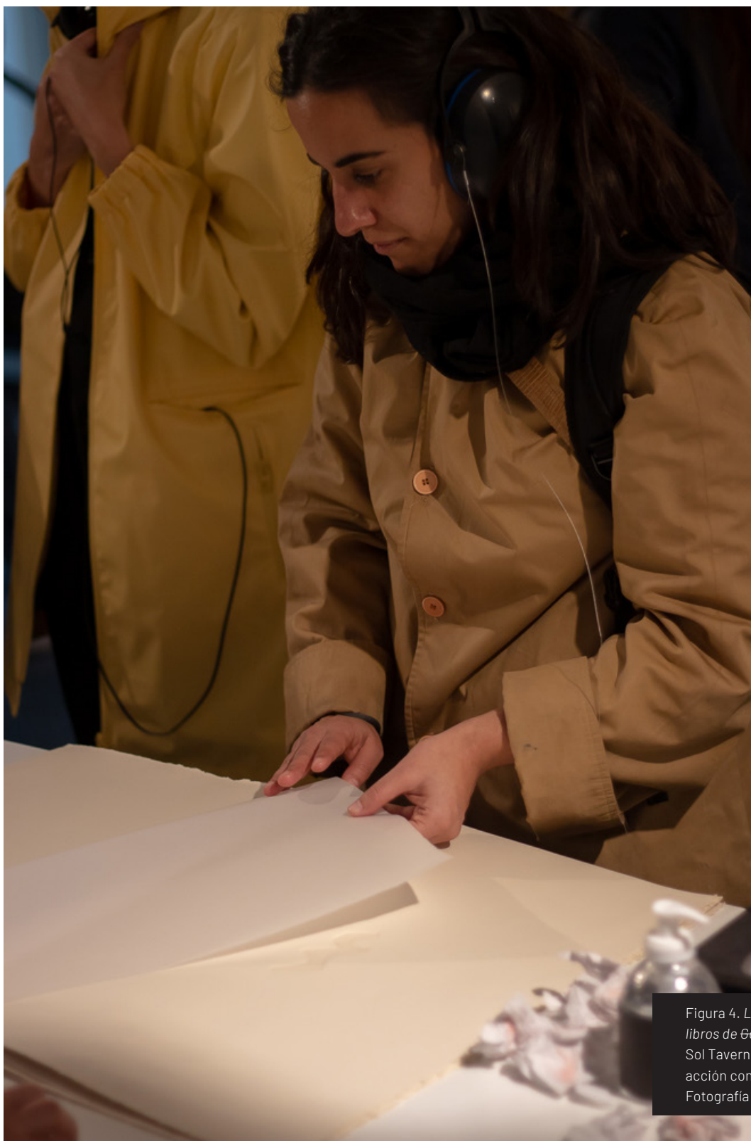
Figura 4. Libro del silencio, Los libros de Gerard (2019), de María Sol Tavernini. El público en acción con protectores auditivos.