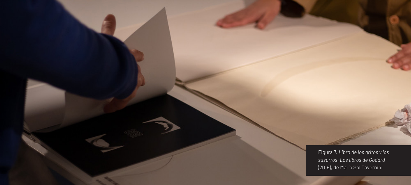
Figura 7. Libro de los gritos y los susurros, Los libros de Godard (2019), de María Sol Tavernini