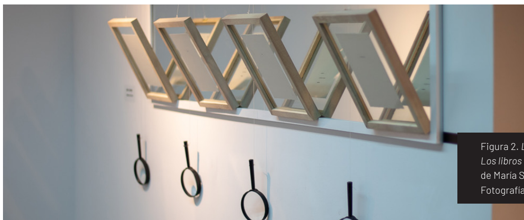
Figura 2. Libro de las miradas, Los libros de Godard (2019), de María Sol Tavernini.

Se seleccionaron algunas frases de la película Histoire(s) du cinema (1988-1998) de Godard. Con la frase Una historia sola (título de una de las partes del audiovisual) 2 se buscó reforzar la condición subjetiva de la mirada e interrogar la concepción lineal de la historia y la concepción de objeto artístico único. Se pretendió, también, incluir abiertamente la condición de una mirada parcial e interesada. Se trabajó de este modo sobre el diálogo con un otro, en la invitación a encontrar nuevos modos de observar e interactuar con el libro de artista como objeto, a partir de la búsqueda de un diálogo intimista, proponiendo el acercamiento corporal y una experiencia guiada por la acción de mirar [Figura 2].