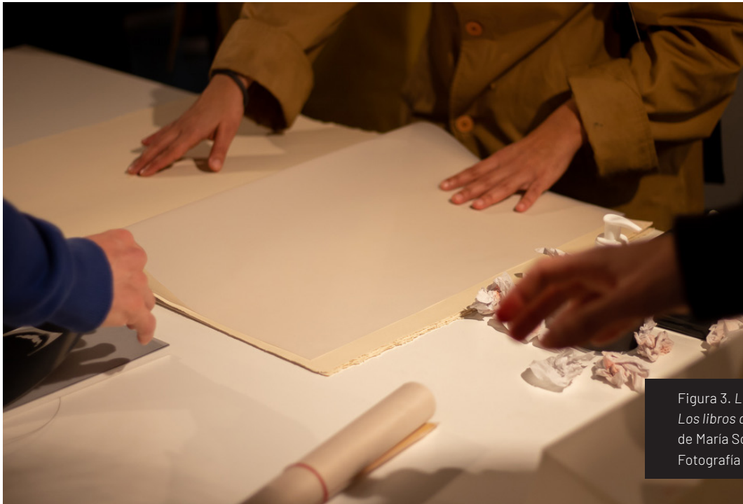
Figura 3. Libro del silencio . Los libros de Gedera (2019), de María Sol Tavernini.

También, mediante el uso de protectores auditivos que negaron completamente el sonido ambiente, fue posible generar un contexto propicio para adentrarse en la experiencia [Figuras 3 y 4].