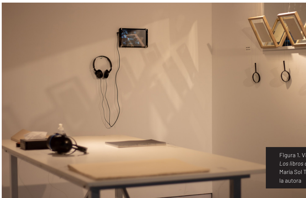
Figura 1. Vista de la instalación Los libros de Godard (2019), de María Sol Tavernini.

La cualidad de ensayo como aquello que permite ser repensado y presupone la imposibilidad de arribar a un final, le dio a este proyecto un impulso para establecer continuidades, generando que inclusive este texto se configure como un intento más [Figura 1].