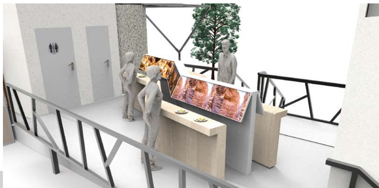
Figura 4. Área de degustación

A través de este anteproyecto se busca lograr que todas aquellas personas que vivan la experiencia puedan abstraerse momentáneamente del entorno en el que se encuentran, dando lugar a que se genere un modelo de interacción dinámica entre los visitantes y las regiones de las cuales se brinda información [Figura 4].