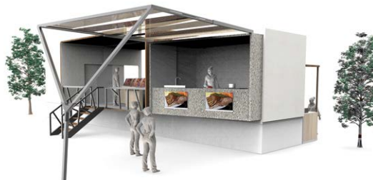
Figura 2. Escenario para clases

Se propone un comedor cultural itinerante que pueda ser trasladado sobre ruedas para recorrer distintos puntos del país y ofrecer temáticas regionales que varíen de manera mensual, con el objetivo de despertar la curiosidad de los comensales a través de la degustación de diversos platos típicos. El mismo brinda la posibilidad de que veinticinco personas, de manera gratuita, puedan disfrutar durante cuarenta minutos de las sensaciones ocasionadas por los sabores y por un conjunto de imágenes auditivas acorde a la región en cuestión [Figura 1]. Una vez finalizada la experiencia, los visitantes podrán aprender las recetas típicas en el exterior, con clases brindadas por cocineros especializados [Figura 2].