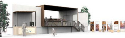
Figura 1. Despliegue del servicio