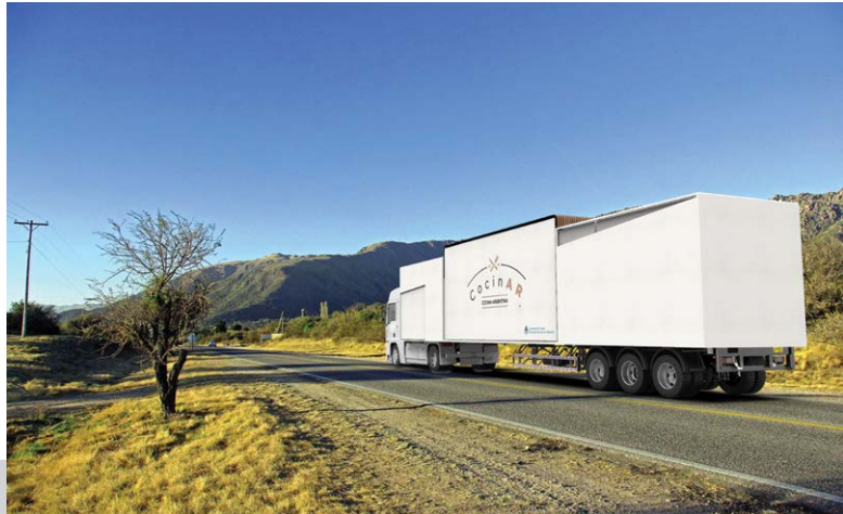
Figura 3. Situación de transporte

El proyecto se desarrolló a partir de la idea conceptual de la comida como medio de interacción social y cultural, por lo que se partió de un espacio que se expande en dos direcciones, lo que da lugar al sitio en donde transcurren las relaciones entre partes, logrando, de esta manera, enfatizar un punto de interacción. Paralelamente, se buscó representar la convergencia de las distintas regiones dentro de un mismo servicio, por lo que se optó por emplear como recurso la superposición de planos y la utilización de diversas texturas y terminaciones superficiales, entre las que se encuentran maderas, piedras y textiles. Se trata de un servicio que tiene la capacidad de implantarse en el lugar de manera itinerante, logrando romper con la linealidad que se requiere para su situación de transporte [Figura 3].