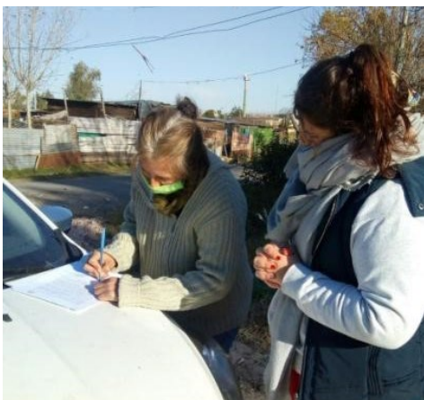
1 Firma del Acta Compromiso

La tasa de interés es del 1% mensual, que en caso de cancelación anticipada de las cuotas, será reintegrado ese 1%. Dicho interés del microcrédito representa una mera cuestión simbólica: no se busca aumentar las ganancias sino contribuir y acompañar a los productores del Paseo en este tiempo difícil.