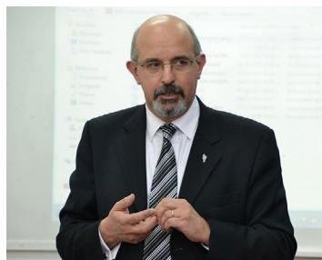
Cr. Carlos Alberto Rumitti Comité Editorial de la Revista AUDITAR

La propuesta de participación es permanente y la vía de contacto actual es revistaauditar@econo.unlp.edu.ar . ■