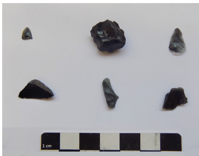
Figura 2. Obsidianas estudiadas por FRX de la localidad arqueológica Las Chapas

Para estudiar la composición química de los desechos líticos de obsidiana y así establecer su procedencia, se empleó la fluorescencia de rayos X (FRX) no destructiva. Los análisis químicos se realizaron en el Laboratorio de Arqueología del IDEAus-CONICET con un analizador portátil Tracer i5, Bruker , perteneciente al Laboratorio de Cultura Material del Departamento de Antropología de la Universidad Católica de Temuco, Chile. Las lecturas se realizaron bajo la modalidad “Obsidiana” mediante un Software de calibración desarrollado por el Missouri University Reactor Research (MURR), de la Universidad de Missouri, Columbia. Se utilizó un colimador de 3 mm y filtro de Cu, y cada exposición duró 60 segundos. Se determinaron