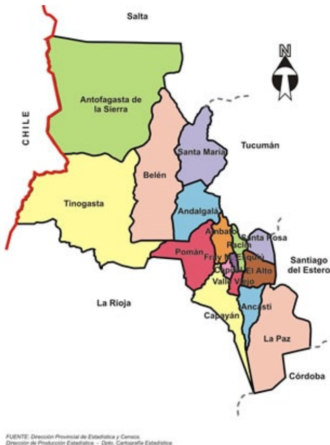
MAPA N° 1 Localización del área de estudio

A modo de cierre entonces, anticipamos cómo la retórica de la modernidad se manifiesta en la colonialidad de la naturaleza apoyada en una jerarquía ecológica y de capital, que en adelante abordaremos.