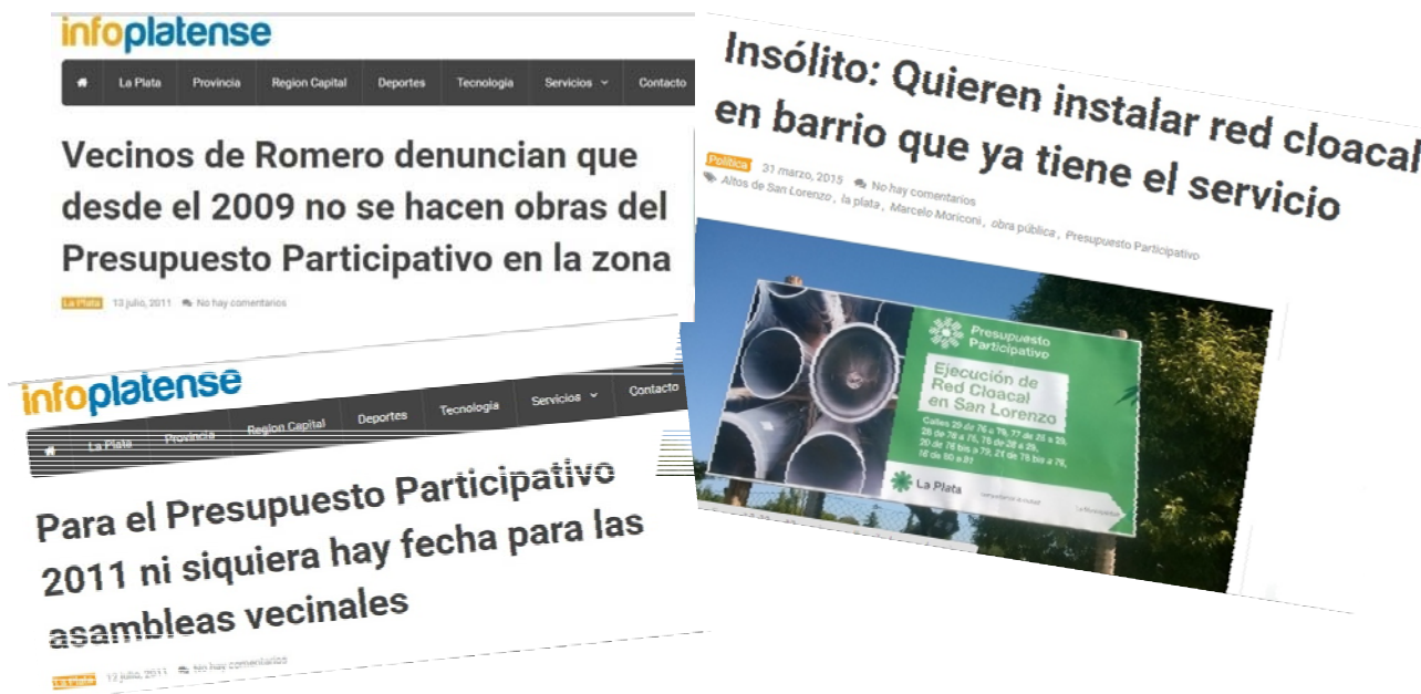
Fig. 1: Información periodística. Fuente: Internet http://infoplatense.com.ar/ .

presupuesto participativo pudo generar conflictos en relación al modo en que la intersectorialidad es incorporada en la ejecución del instrumento, ya que generar una nueva dependencia puede favorecer la desarticulación y perder la integralidad de los problemas, además de incorporar nuevos actores e instituciones quizás innecesarias. Repetto (2008) menciona que el exceso de subdividir organismos en diferentes áreas puede conllevar a generar tensiones en las relaciones de poder de quienes están a cargo, provocando la ineficacia e ineficiencia del sistema. Estas cuestiones pueden reflejarse en la opinión de algunos vecinos en relación a lo producido con los recursos de esta herramienta.