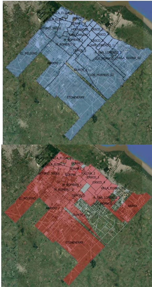
Fig.2: Organización territorial del PP año 2008 y 2015 en La Plata. Imagen satelital de Google Earth + Elaboración propia de mapeo en GIS de la zonificación.

Para el año 2015 se llega a una organización en 30 regiones presupuestarias en total: las regiones del casco se unifican en Casco 1 y Casco 2, y desaparecen las correspondientes a Los Hornos III, San Carlos III, Altos de San Lorenzo III, Tolosa III y Villa Elvira III, sin especificarse en ningún documento si fueron absorbidas por otras regiones presupuestarias. Por otro lado, se crea la delegación Arana en parte de lo que fue la Subdelegación Villa Elvira III.