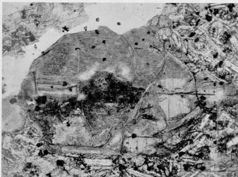
1. Iddingsita (partes más claras con clivajes marcados), una clorita (oscura, en el centro y a la izquierda) y un agregado clorítico-serpentinoso que han sustituido a una olivina de contorno hexagonal, en un basalto del Cerro Caichihue. Con el solo polarizador. \times 132 .