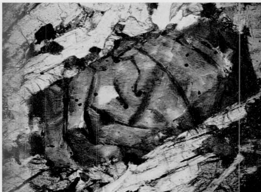
2. Serpentina ferrífera que sustituyó al piroxeno en la dolerita de la ladera occidental del Cerro Mesa. Con polarizador solamente. \times 87