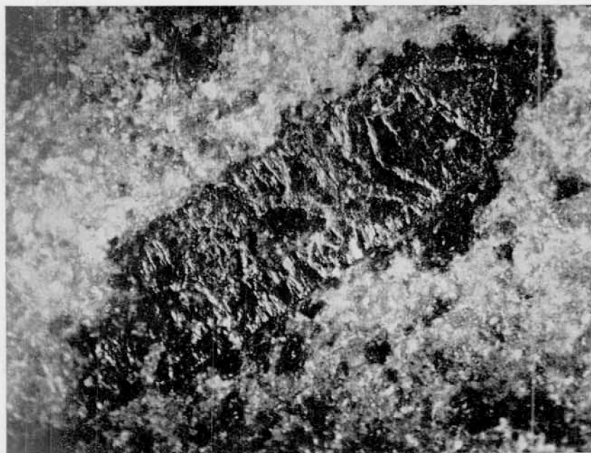
2. Sustitución de la olivina por hematita; sobre el fondo rojizo se destacan puntos brillantes determinados por las superficies de clivaje de la hematita; observado en una porfirita del Cerro Gharahuilla. Microfot. con luz reflejada, con epicondensador Zeiss. \times 122 .