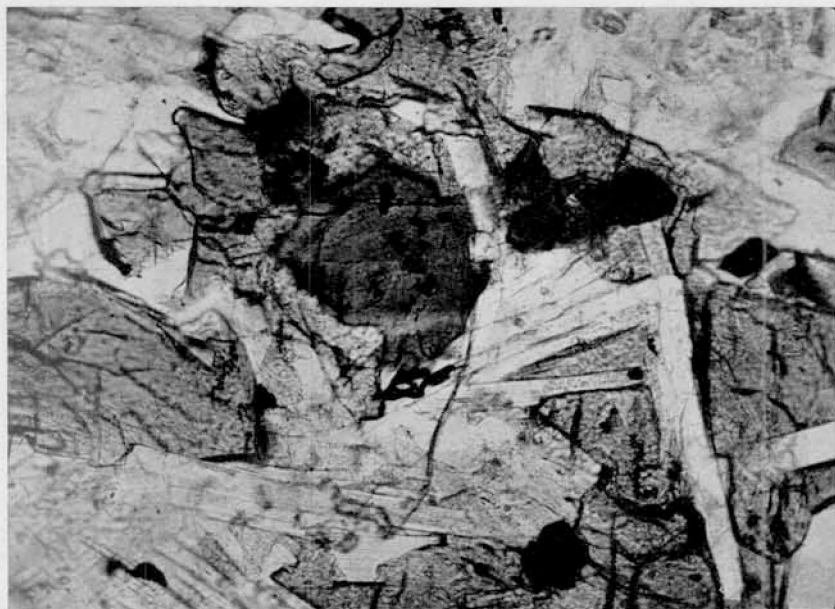
1. Plagioclasas, piroxenos e iddingsita que sustituyó a olivina en la dolerita de un dique al W de la escuela n° 4 de Piedra Pintada. Con el solo polarizador. \times 87