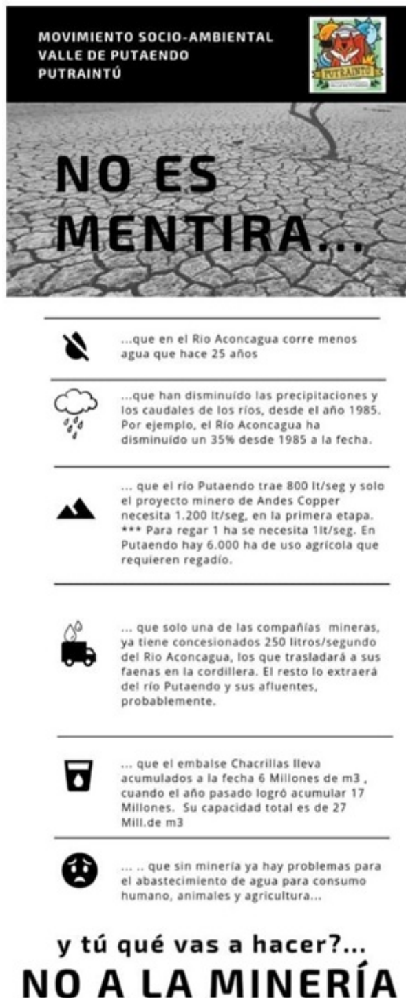
Figura 2. Infografía difundida por el Movimiento Socioambiental Putraintú

Tal y como afirma Sobreiro Filho (2017), recuperando los aportes de Tarrow y de Lietner, las acciones contenciosas –como acciones políticas y sociales que desafían el sistema hegemónico y buscan establecer