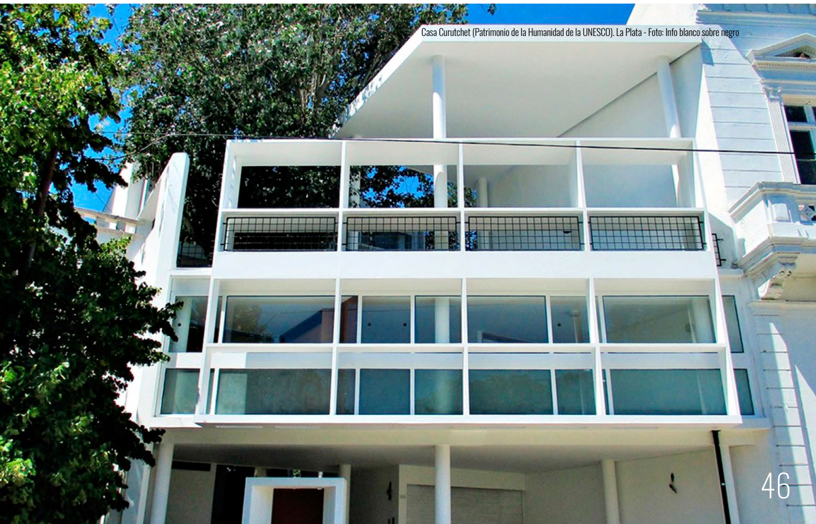
Casa Curutchet (Patrimonio de la Humanidad de la UNESCO). La Plata

La ciudad de La Plata es uno de los municipios relevados con mayor cantidad de recursos turísticos en toda la Provincia. Como es de esperar, la tipología de recursos que predomina (más del 50%) son los recursos históricos: sus museos, palacios, teatros, la Casa Curutchet (Patrimonio de la Humanidad de la UNESCO), bibliotecas, iglesias (destacándose la Catedral de la Inmaculada Concepción). Es importante mencionar, entre sus