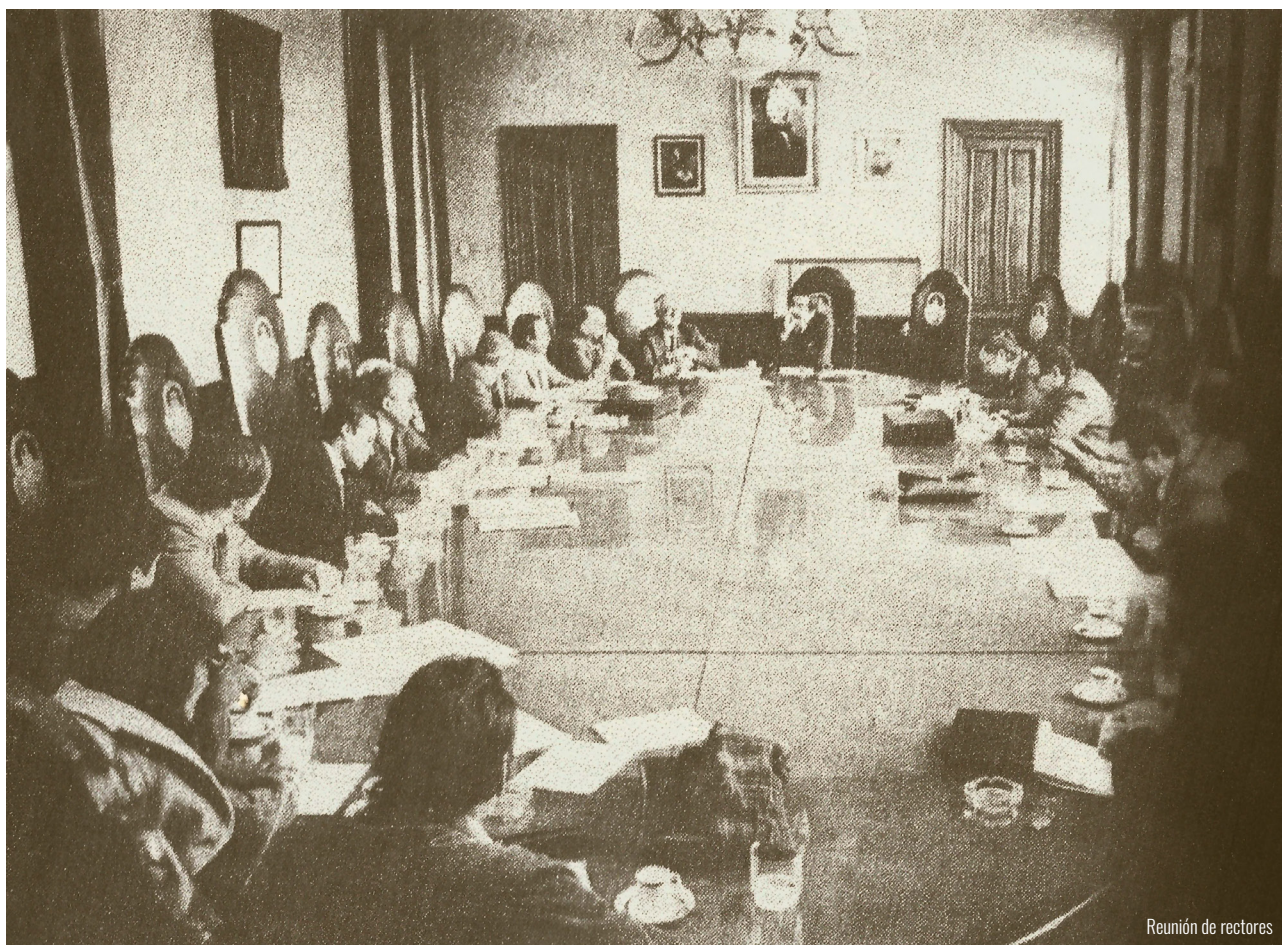
Reunión de rectores