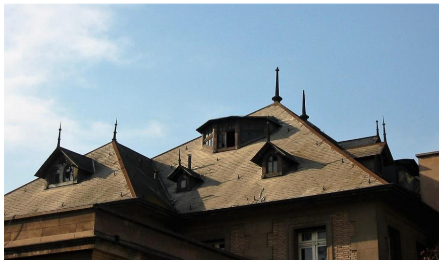
Foto del techo del edificio de República 475. Fue tomada antes de que procediéramos a la remodelación. Se había construido un cielo falso que impedía llegar a las ventanas del tercer piso.

A fines de septiembre de 2005, mientras avanzábamos en los trabajos de restauración, decidimos desmontar las planchas de volcanita del cielo del tercer piso. De pronto, en medio de la sorpresa de los trabajadores, comenzaron a caer láminas de papel manila tamaño 80 x 110 cm. Esto fue un hallazgo impresionante. Todos miraban cómo iban cayendo estas piezas. Eran 12 pliegos amarillentos, de color crema. Se trataba de diversos documentos con información sobre la orgánica y el funcionamiento de este aparato represivo. Uno de ellos contenía el diagrama con la estructura y el presupuesto de la CNI, previstos para su ejercicio durante el año 1982. En otro rincón, semi ocultos tras un modesto estante, se encontraron una serie de télex, oficios, y otros documentos