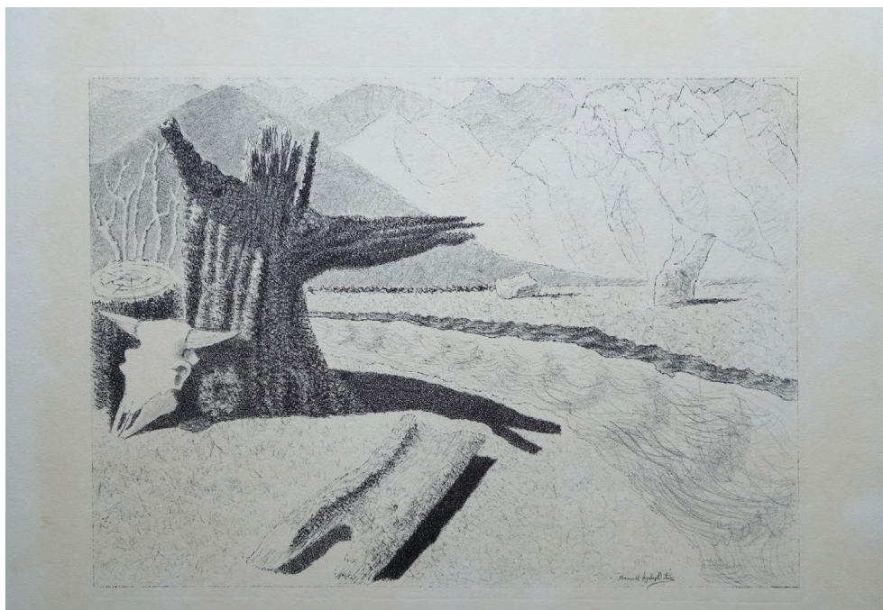
Figura 2. Manuel Ángeles Ortiz. Obra de la carpeta Estampas litográficas originales: A campo abierto (1941). Buenos Aires. Litografía sobre papel, 40 x 47 cm. Colección privada

[...] las 6 planchas fueron dibujadas y litografiadas por Manuel Ángeles Ortiz inspirándose para sus composiciones en características de los paisajes del Parque Nacional del Nahuel Huapí, región de Neuquén y Río Negro. La tapa, contratapa y portada fueron compuestas y dibujadas por el artista. La obra fue impresa por el obrero litógrafo Luis A. Peri, en las prensas de la Casa Nagel [Figura 2].