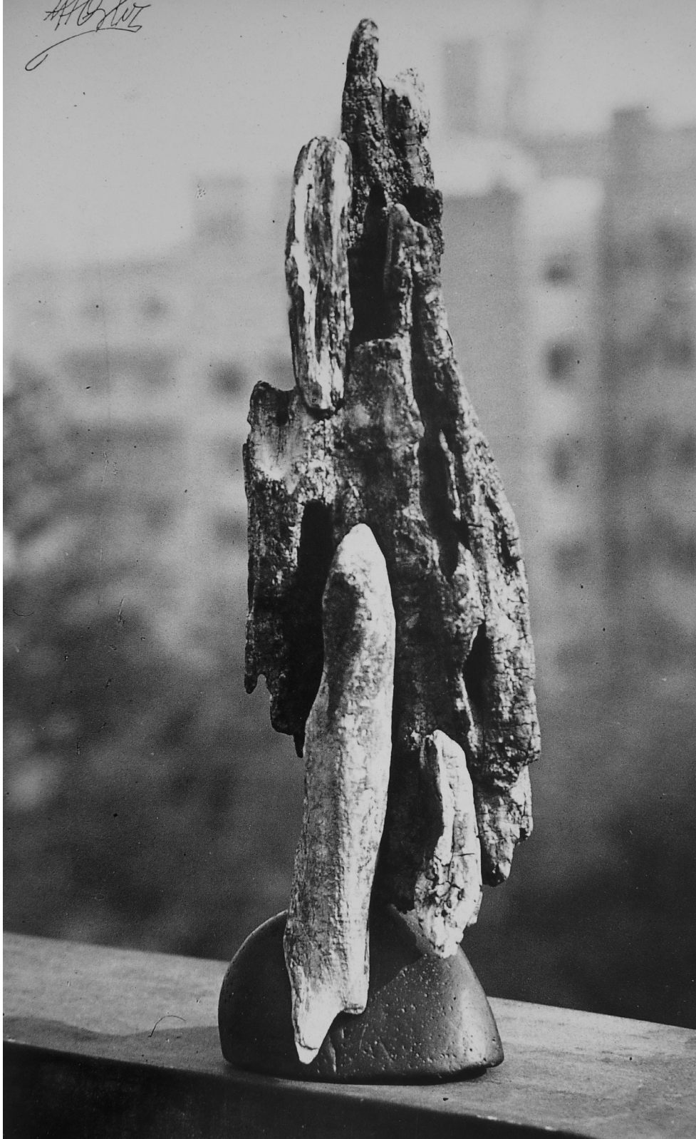
Figura 4. Grete Stern. Fotografía de una de las construcciones de Manuel Ángeles Ortiz. Gelatina de plata sobre papel. (Repr.: Davidov & Carmona, 1996, p. 66)

Entre el 26 de julio y el 9 de agosto de 1943 Manuel Ángeles Ortiz llevó a cabo la que sería no solo su primera exposición individual en la Argentina, sino también la que marcaría su consagración: «Construcciones, maderas y piedras patagónicas», en las salas 4, 5 y 6 de la Galería Müller de la calle Florida 935 [Figura 5]. En ella, exhibió, como consta en el catálogo, 39 maderas, nueve piedras, cinco pinturas de Lago Nahuel Huapi, ocho dibujos de alrededores del Lago Mascardi y niñas araucanas, un cuaderno de seis litografías inspiradas en características del paisaje de la región de los lagos del sur (es decir el álbum A campo abierto), un Paisaje costero del Río de la Plata, una Mujer enhebrando una aguja y un Niño y mujer desnudos.