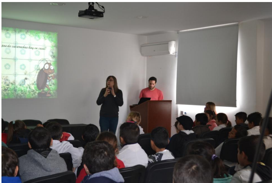
Charla para una escuela primaria