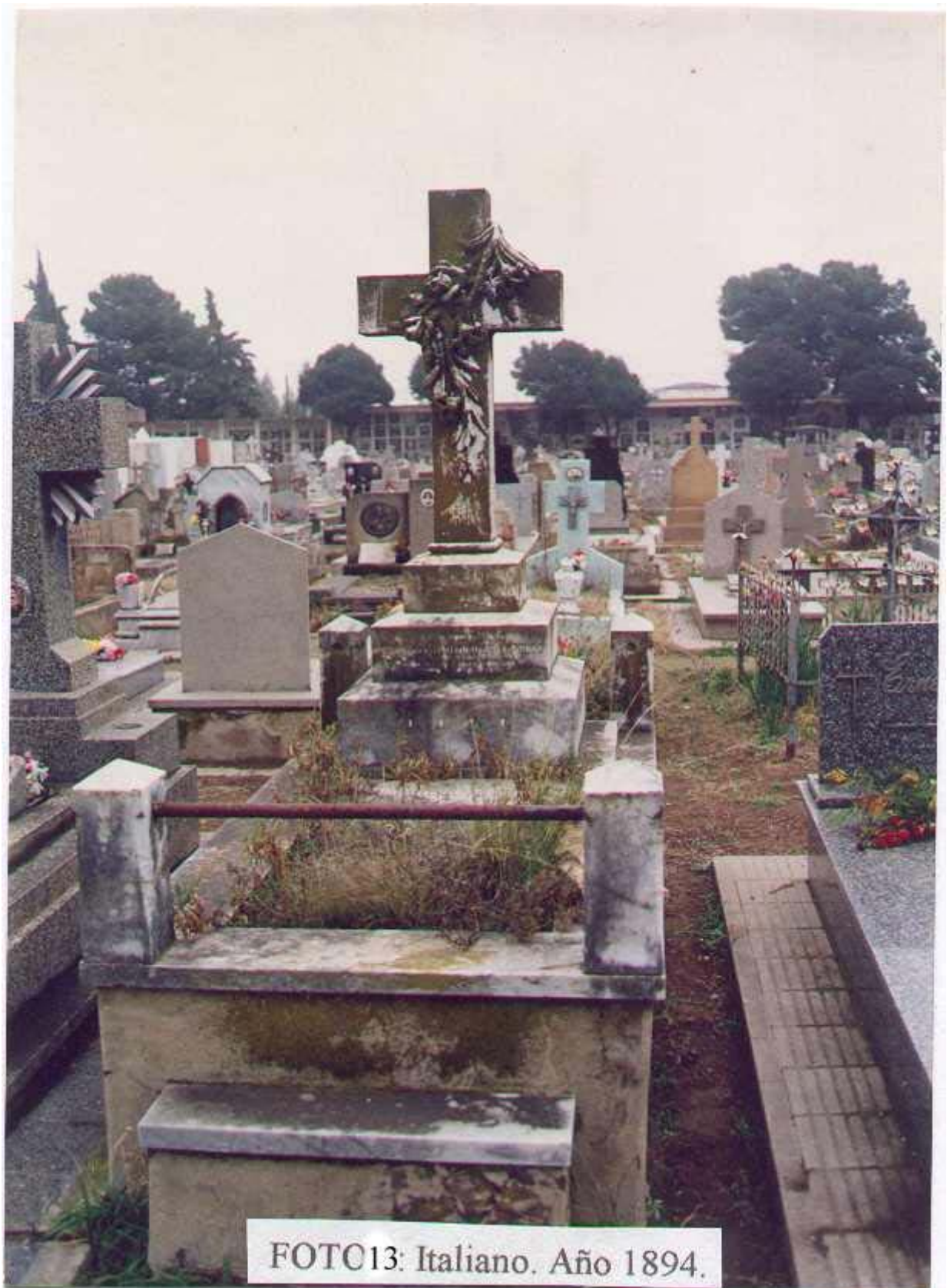
FOTO13: Italiano. Año 1894.