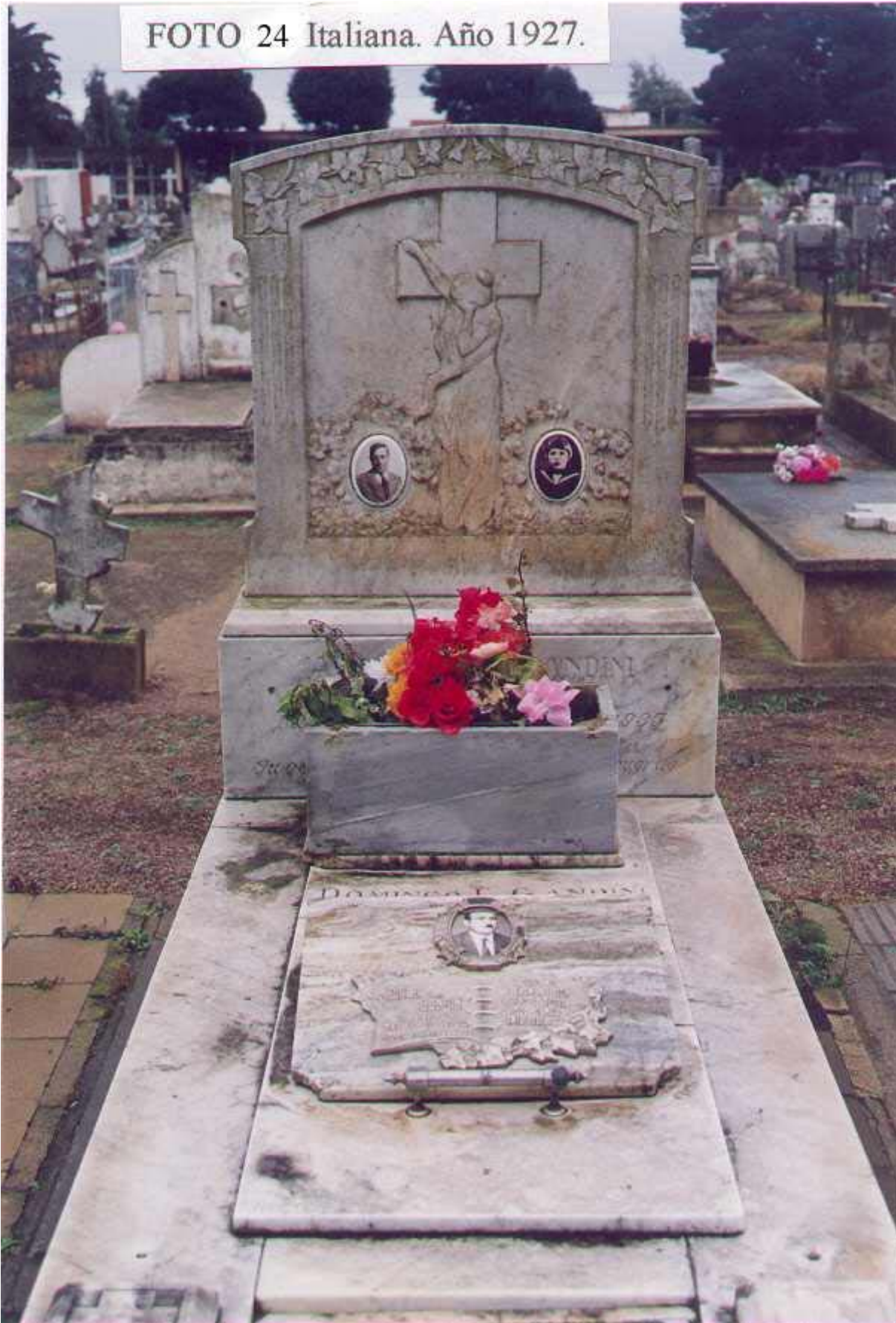
FOTO 24 Italiana. Año 1927.