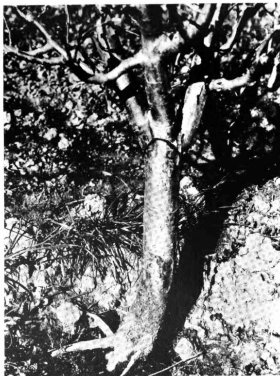
Manzano de diez años atacado por P. cactorum ; la línea negra indica hasta donde llega la necrosis