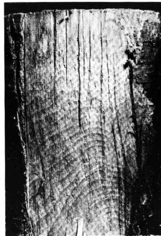
Tronco de manzano en cuyo leño se notan líneas concéntricas de avance del parásito