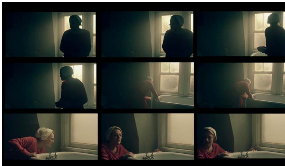
Figura 1. Frames del capítulo «Night». Puede advertirse la transformación de los detalles en la configuración del cuerpo y el rostro, dada por el movimiento del cuerpo y su posición respecto de la luz

Una fuente de luz única, una ventana, descubre a partir de un sutil movimiento del personaje o de la cámara una transformación de las relaciones plásticas globales: visibilidad de unas facciones, opacidad de unas telas, cambio de la distribución de pesos en el espacio, presencia o ausencia de microritmos dados por las partículas del aire. 1 Refiero, en tal sentido, a la posibilidad de que ese dibujar con luz no delimite la configuración de un mundo visible, de contornos estables. Por el contrario, despliega el juego del modelado y la modulación, habilitando la configuración de relaciones espacio-temporales en el plano o dentro del plano, de modo que las figuras devienen objetos móviles, inestables, susceptibles de ofrecer matices, rugosidades y texturas que descubre —y oculta— el movimiento de la luz [Figura 1]. 2