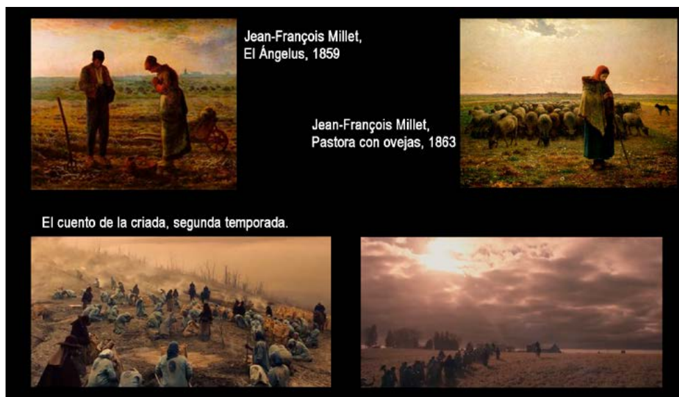
Figura 4. Pastora con ovejas (1863) y El Ángelus (1859), Millet. Frames de El cuento de la criada . Advertir el vínculo en el tratamiento de la luz