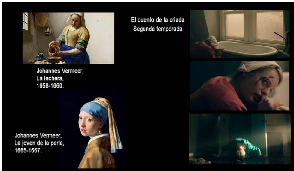
Figura 3. La joven de la perla (1665-67) y La lechera (1658-60) de Vermeer. Frames de El cuento de la criada . El claro-oscuro y la relación cromática dialoga con la poética de la luz en Vermeer