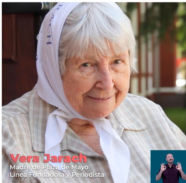
Figura 1. Micro Historias

Con los objetivos ya planteados desarrollé una estrategia: crear un taller con el eslogan Construyendo legado en las escuelas secundarias de la provincia de Buenos Aires, que culminara con un evento en la Casa Nuestros Hijos la Vida y la Esperanza.