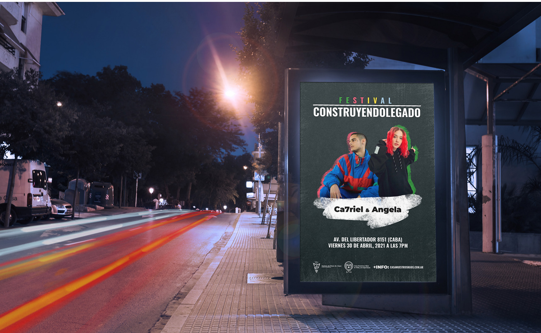
Figura 5. Afiche publicitario

Para la segunda fase, el festival, se invitaron artistas, escritores, músicos e ilustradores. Diseñé varias piezas de comunicación y difusión tales como afiches publicitarios, publicidad en redes, folletos informativos, certificado de participación, merchandising y una página web informativa [Figura 5].