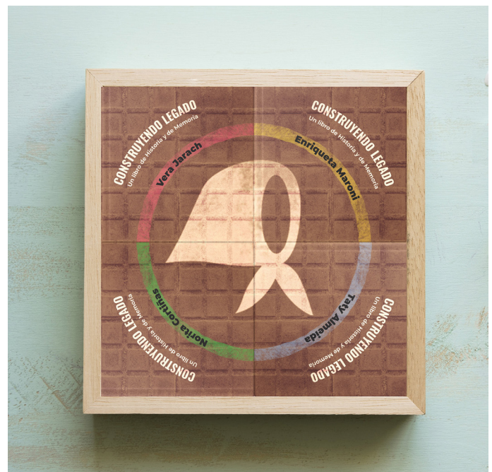
Figura 4. Libro objeto