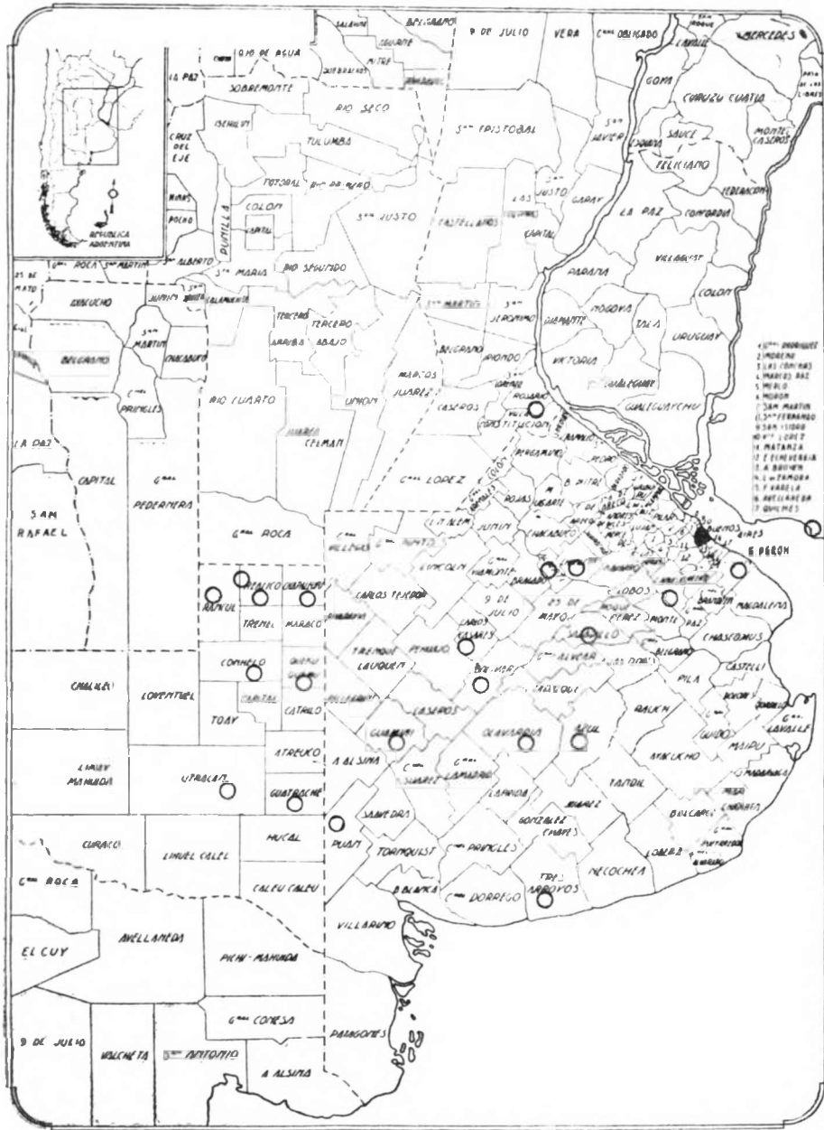
Lugares del país, en que se ha hallado Tilletia contraversa