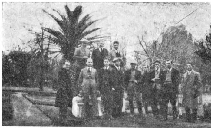
El grupo de los alumnos excursionistas en la Estancia San Cristobal (Santa Fé)

institución, única en el país por el sistema de experimentación. Luego, revistados los cultivos de las provincias de Córdoba, Santa Fe, islas del Paraná, Santiago del Estero, Tucumán, prestando particular atención a los cultivos de caña de azúcar, con la oportunidad de observar la zafra; y los cultivos hortícolas de los valles del Aconquija y Quebrada de Lules; los cultivos de Salta; las colonias de más renombre por los resultados obtenidos con el algodón, en la gobernación del Chaco, tales como las colonias de Charata, Peia. Sáenz Peña, Gral. Pinedo, Quitilipi, Michigal, etc.; cultivos subtropicales, algunos en vía de ensayo en esta gobernación y en la provincia de Corrientes.