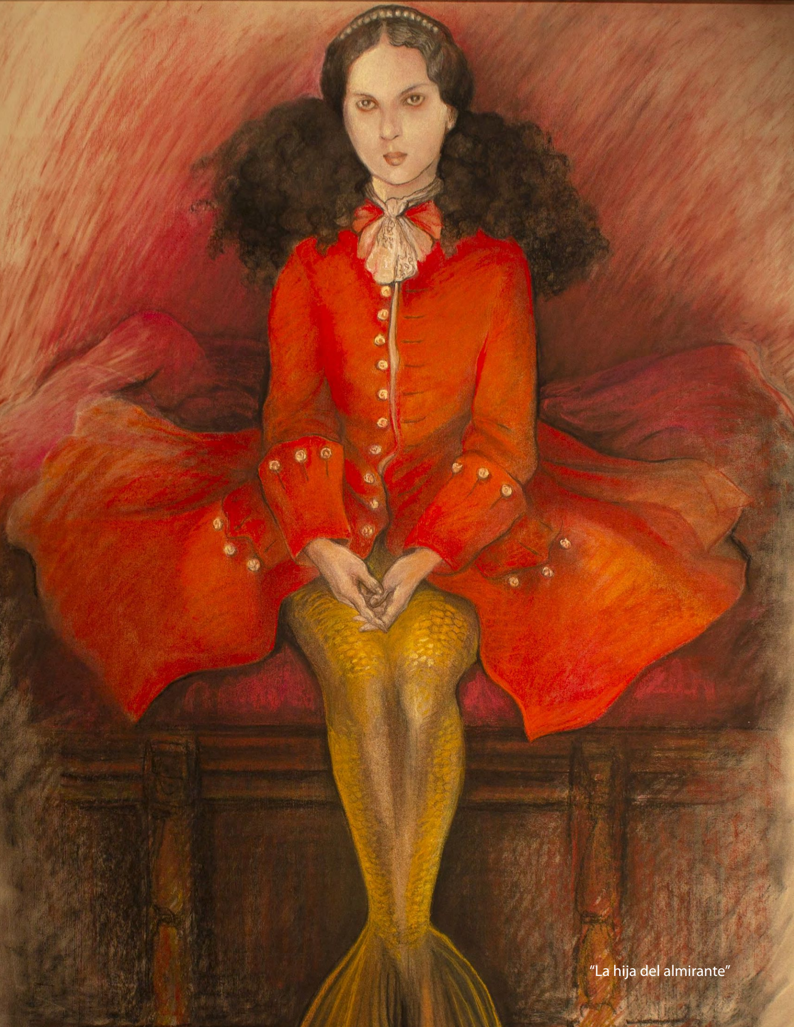
"La hija del almirante"