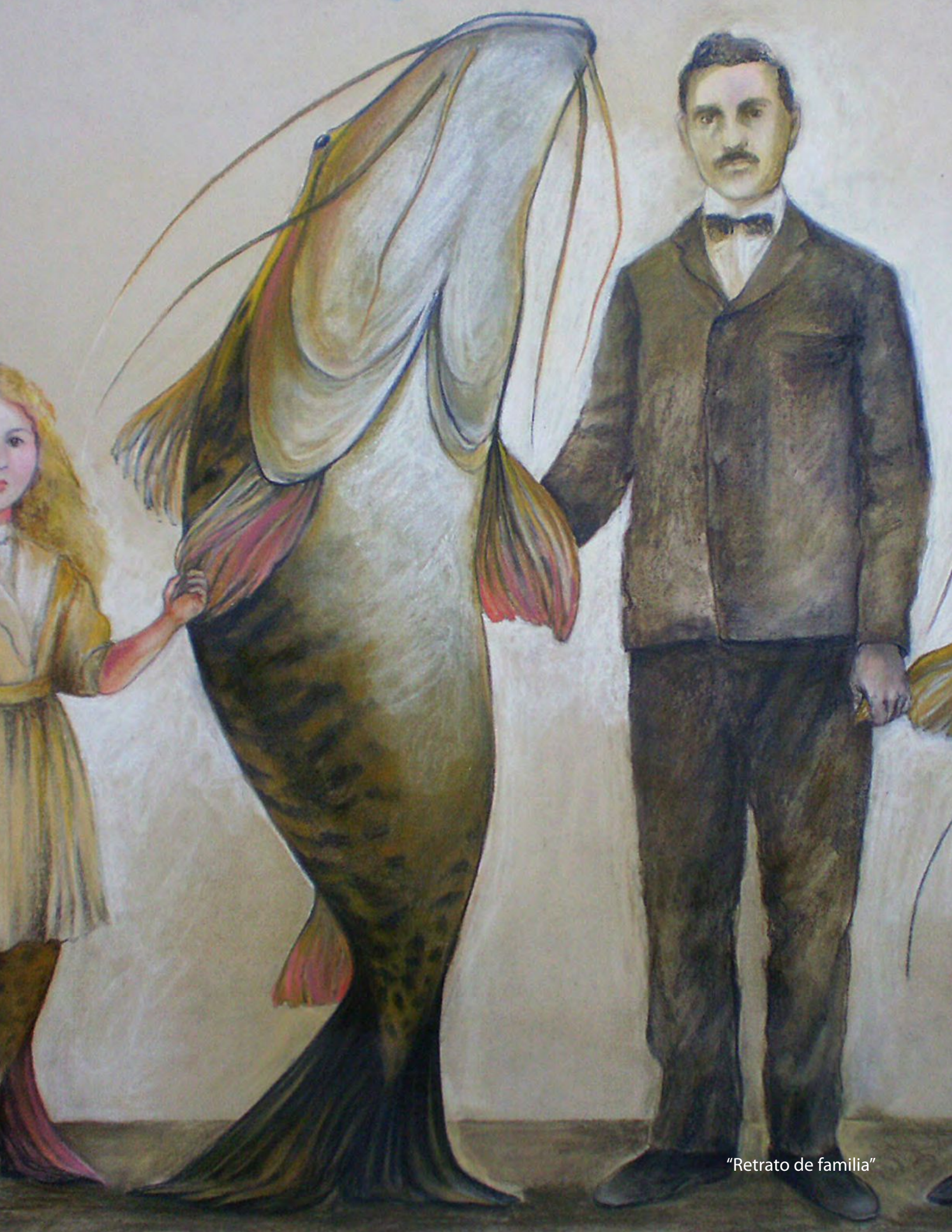
"Retrato de familia"