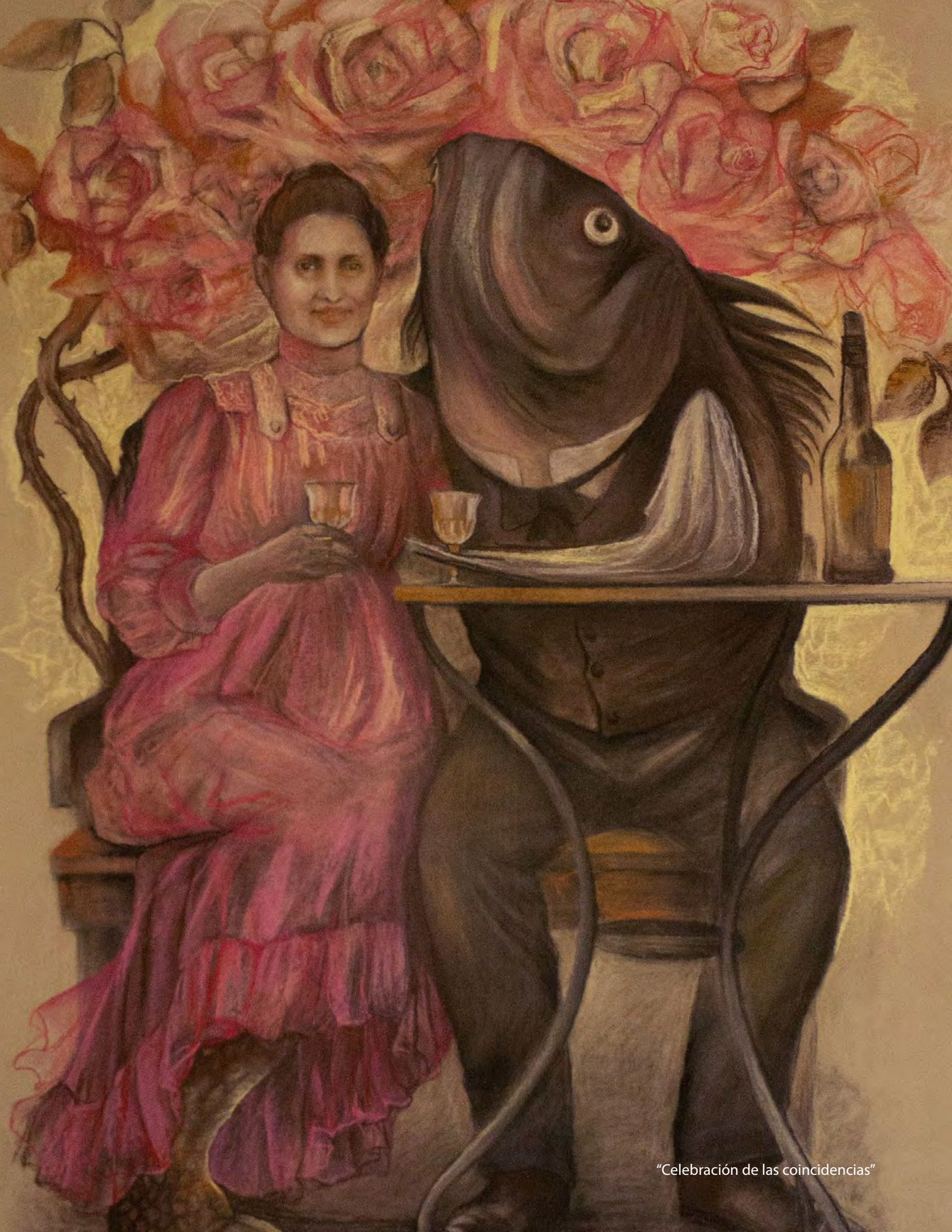
"Celebración de las coincidencias"