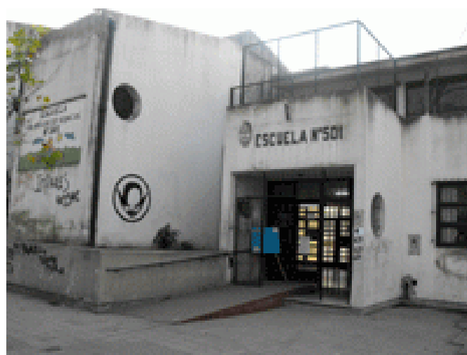
Escuela Especial 501 de Florencio Varela

Como parte de un recorrido continuo en la formación como docente, un camino elegido para la experiencia y la profesionalización de mi rol en la educación, y como un trayecto de investigación y cuestionamiento para poder desempeñar con criterio mis tareas en función de mis intereses (ser un docente consecuente) me propongo iniciar una investigación sobre la educación artística en las escuelas públicas de educación especial, sobre su material teórico y práctico de referencia, para los/as docentes de teatro y para quienes trabajan en escuelas especiales, y por mi alcance, pertenecientes al distrito en el que resido: Florencio Varela. Más específicamente aún, sobre la implementación de juegos teatrales en las aulas de dichas instituciones. Previo a un análisis de las prácticas de docentes en las aulas, contextualizaré el marco legislativo a fin de fundamentar lo expuesto en ésta primera aproximación a un proyecto de investigación de la educación artística al que acceden personas con discapacidad.