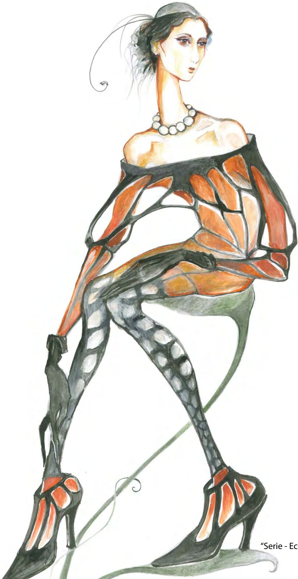
"Serie - Eco de Mariposas"