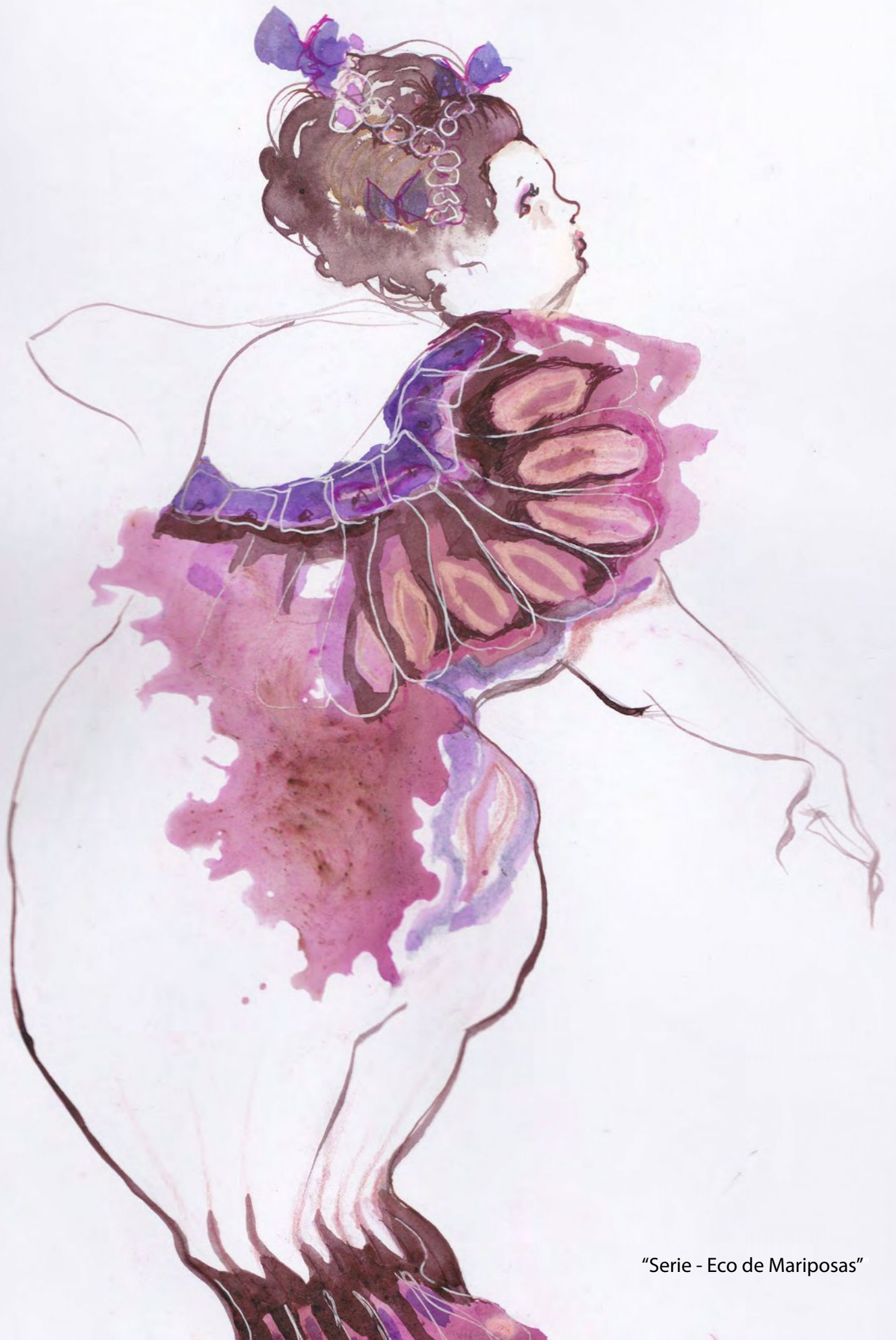
"Serie - Eco de Mariposas"