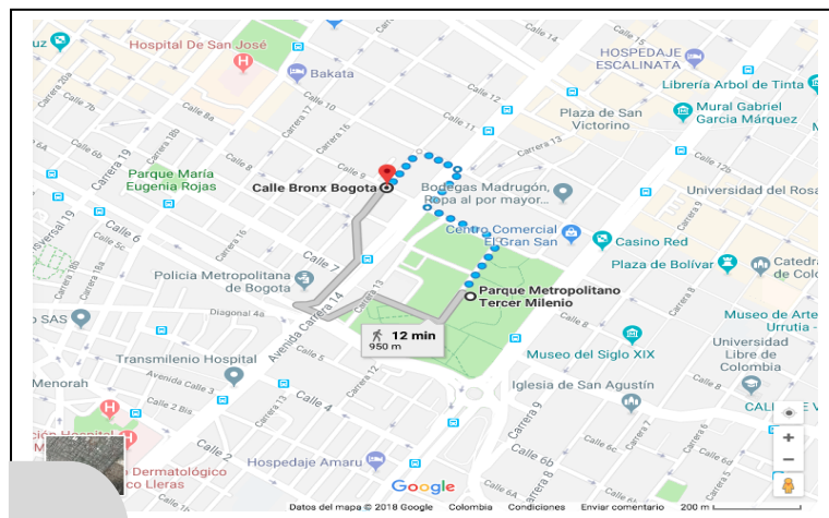
Imagen 1 | Parque Tercer Milenio, antiguo El Cartucho, y calle del Bronx, Bogotá, Colombia

calle del Bronx, en la misma localidad. Según la encuesta del censo 2017, los mayores porcentajes de cantidad de habitantes de calle por localidad se concentran en Los Mártires y en Santa Fe, con un total de 3.063, lo que equivale a 32,1 % del total de habitantes de calle en toda la ciudad.