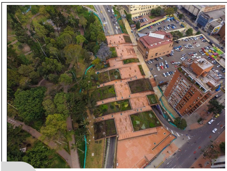
Imagen 5 | Parque Bicentenario, Bogotá, Colombia. Firma Mazzanti Arquitectos, 2017

El trabajo de forma descrito implica, además, que la presencia de los espacios se exponga. A este propósito, el proyecto de Rem Koolhaas y su agencia OMA, para el concurso de Les Halles en París, presenta un espacio público ejecutado por encima de las líneas de metro y de trenes de cercanía —a través de un trabajo técnico que produce formas que muestran en la superficie lo que se encuentra abajo—, que expone lo que otros proyectos para el mismo concurso ocultaban o cubrían, las mismas vías de las líneas de metro. Este proyecto hace todo lo contrario de un proyecto reciente en Bogotá que, como las operaciones de renovación urbanas, hacen desaparecer el espacio sobre el que se montan, cubriéndolo. El proyecto referido es El Parque Bicentenario [Imagen 5], en donde la superficie propuesta oculta las vías existentes. 15