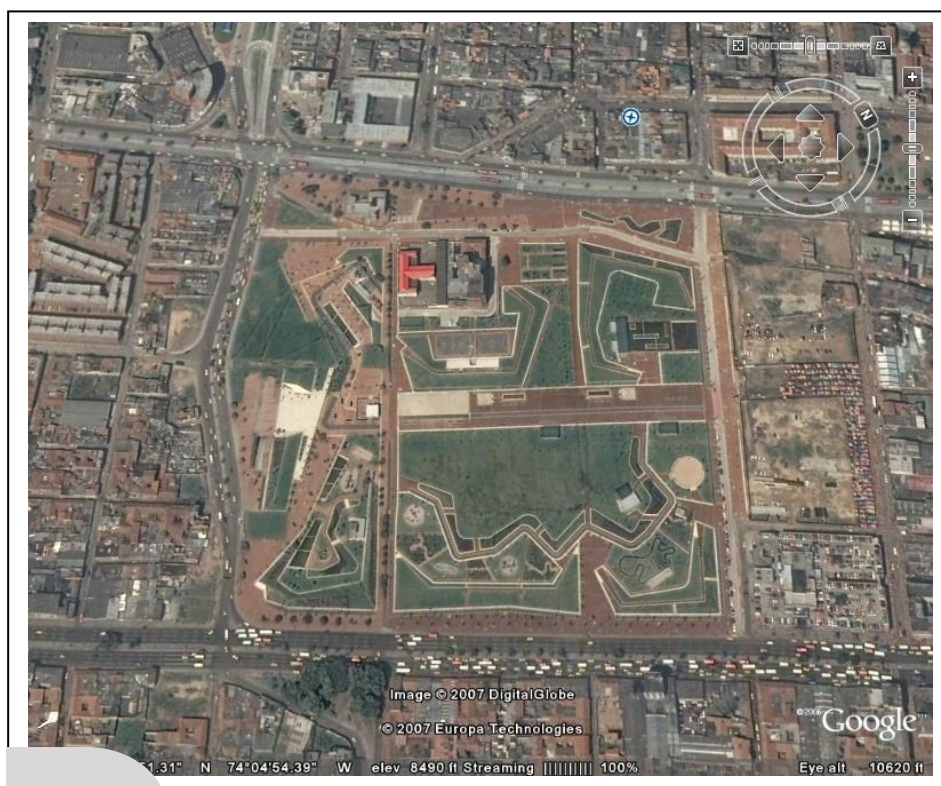
Imagen 4 | Parque Tercer Milenio, Bogotá, Colombia, 2002

En el caso del parque Tercer Milenio que remplazó a El Cartucho, el nuevo espacio público se dirige a la ciudadanía y debería articular dos sectores de la ciudad, a partir de redefinir el espacio y sus partícipes (cosa que nunca sucedió) y de desalojar a sus antiguos ocupantes [Imagen 4]. Lo mismo se espera que suceda con el proyecto de Renovación Urbana de El Bronx, denominado Plan Parcial Voto Nacional. Lo mismo, quizás, no suceda de nuevo. La operación descrita a partir de las tácticas de guerra no implica la conquista de un territorio, sino su reorganización según los procesos que deban ser maximizados.