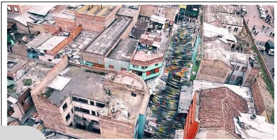
Imagen 3 | Calle de El Bronx, Bogotá, Colombia, 2015

Algo similar sucede con el espacio que finalmente acogió a muchos de los/as habitantes de El Cartucho, esto es, El Bronx [Imagen 3]. Su desalojo resultó útil en tanto filtro, ya no de un desastre natural sino de operaciones urbanas que sirven como experimentación para futuros planes de desarrollo en otros sectores de la ciudad. En El Cartucho, el ejercicio urbano consistió en una renovación a la manera de tabula rasa; en El Bronx se reprodujeron los mismos términos de la operación: destruir todo lo existente y construir edificaciones que integren usos múltiples, para recuperar el sector y para revitalizar el área a fin de que se transforme en un espacio adecuado para la apropiación por parte de los denominados ciudadanos.