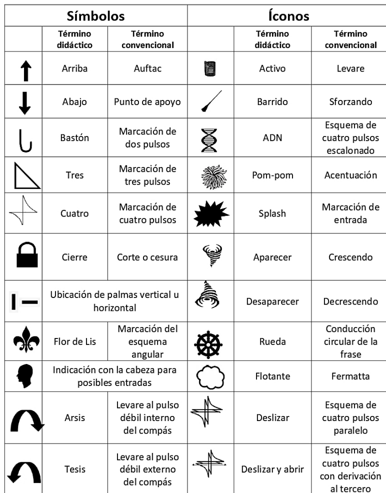
Figura 3. Símbolos e íconos de IADA. Elaboración propia.