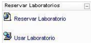
Figura 1 – Aspecto del bloque ReLab

Como puede apreciarse en la Figura 1, el cuerpo del bloque consiste en dos vínculos: el primero permite ingresar a la página que administra los recursos de los laboratorios, mientras que el segundo es el acceso para utilizar el laboratorio. Ambos vínculos presentan una interfaz web con un encabezado y pie común, lo que permite que a partir de cualquier vínculo, se pueda llegar a la administración de los recursos y la gestión de las reservas.