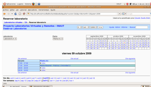
Figura 2 – Pantalla principal

La Figura 2 muestra la pantalla principal que ve cualquier usuario registrado cuando ingresa. En este caso la imagen muestra la pantalla correspondiente para una fecha con horarios registrados para una planta determinada.