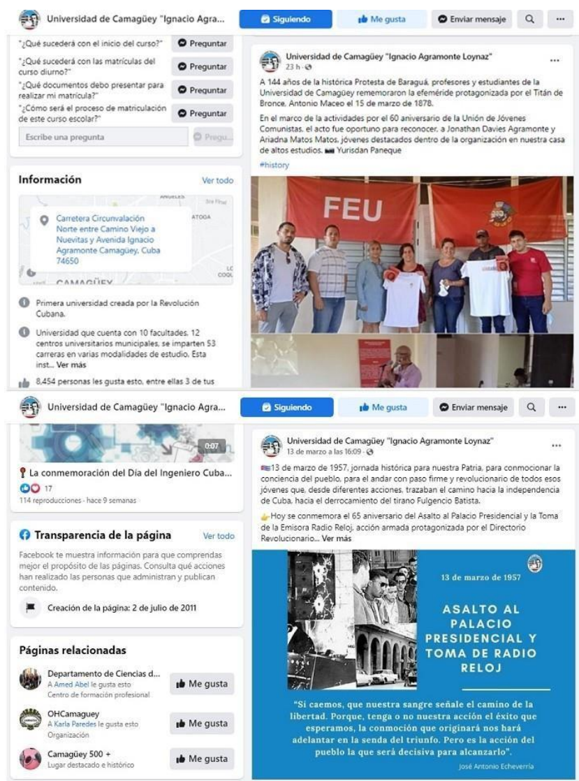
Figura 2: Notas informativas divulgadas en el perfil institucional de la Universidad de Camagüey en Facebook.

En consonancia con las corrientes teóricas, los mensajes tienen la función de reproducir y propagar la ideología dominante, por lo que deben influir positivamente en las tareas del desarrollo económico, social y cultural del país. Asimismo, se supeditan a las