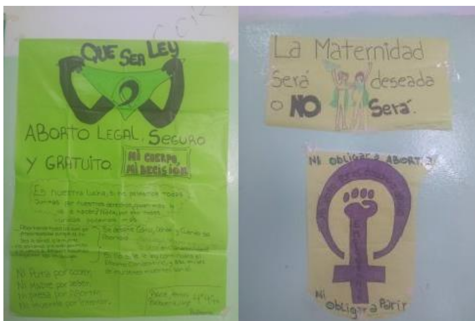
Figura 5: diciembre 2019, fotografía tomadas en los pasillos de la escuela.

La producción de esta discursividad militante no solo fue vehiculizada en producciones y publicaciones docentes, sino también, por ejemplo, en una serie de afiches elaborados por estudiantes en clases y Jornadas ESI. Así como la cuenta de Instagram resultó un lugar privilegiado para analizar los márgenes de enunciación pública, estos carteles, ubicados en pasillos y puertas, se inscribían en ese mismo universo visible que marcaba pautas acerca de lo decible e imaginable en la escuela.