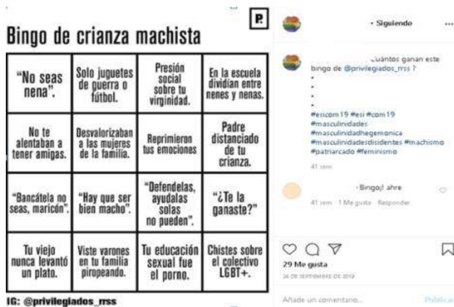
Figura 4: septiembre 2019, Instagram Equipo ESI.

El "Bingo de crianza machista", observable en la Figura 4, es un ejemplo de cómo, mediante un uso polémico de la metáfora (Angenot, 1982; di Stéfano, 2006), se buscaba conmover al interlocutor. La pregunta que acompañaba la imagen también intentaba provocar una reflexividad crítica en el enunciatario ("¿cuántos ganan este bingo?"). En cuanto al enunciatario queda claro, analizando los casilleros del "bingo", que se trataba de un sujeto que podía adscribir o no, en un bingo no todos ganan a características estereotípicas de la masculinidad. Distintas expresiones "típicas" de una conversación entre varones ("Hay que ser bien macho", "No seas nena", "¿Te la ganaste?") o enunciados en donde se delimitaba a un "otro" marginalizado ("Defendelas, ayudalas, solas no pueden" o "Bancátela, no seas maricón") así lo demostraban. En ambos casos, es posible inferir que el sujeto enunciatario al que se apelaba era un varón no convencido de las causas de los feminismos o no reflexivo en cuanto a la posición de "privilegio" que ostentaba y por lo tanto susceptible de reproducir la opresión.