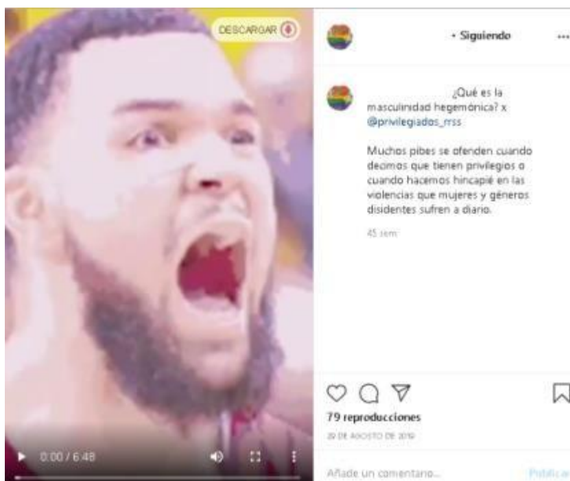
Figura 3: agosto 2019, Instagram Equipo ESI.

Todo sujeto enunciator, es decir, esta producción discursiva de un yo, para constituirse como tal, debe involucrar a un tú, es decir, a un sujeto enunciatario. Para analizar su producción en el caso que nos atañe, tomamos una serie de publicaciones del corpus seleccionado: