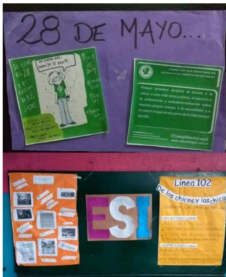
Figura 1: mayo de 2019, fotografías tomadas en los pasillos de la escuela.

En suma, para buena parte de sus miembros, la escuela empezó a definirse, como expresó una docente de larga trayectoria en la misma, como una institución “contenedora”. En esta forma de concebir y narrar a la escuela, la ESI adquiriría sentido como un puntal en la lucha de muchas y muchos de sus integrantes por discutir las desigualdades entre las distintas identidades de género y sexuales. La concepción de la ESI como una causa militante fue un guión disponible que orientó las pautas posibles y deseables de su abordaje, pero no sin contradicciones y matices.