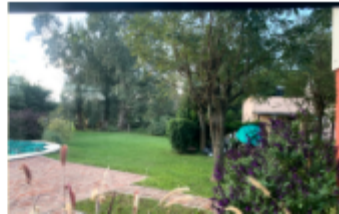
The Sunset from my car window