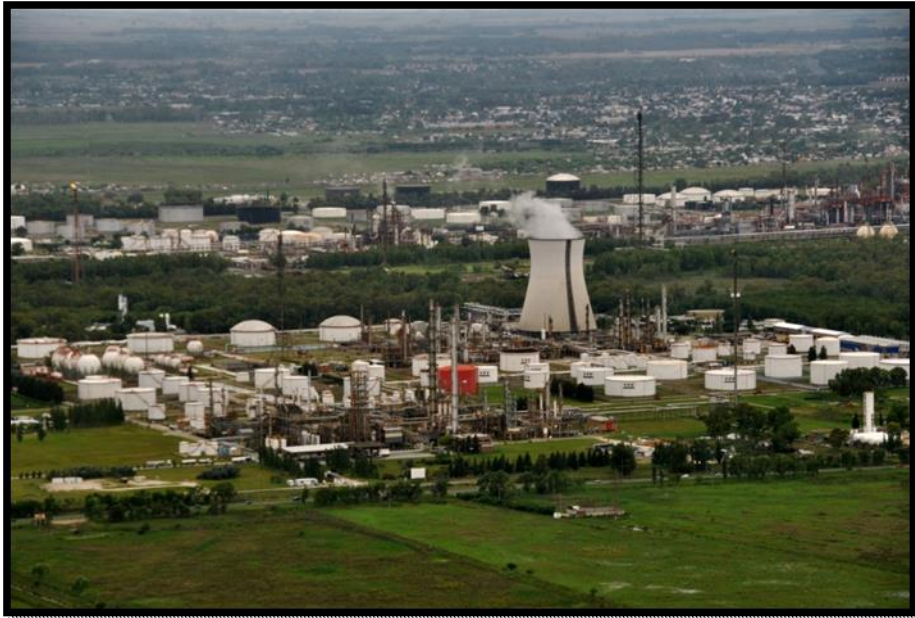
Figura 2: Polo Petroquímico de Berisso-Ensenada

Estas personas conviven cotidianamente con ruidos, olores, pérdidas y lluvias de hidrocarburos. El conflicto en torno al Polo lleva décadas de presentaciones, juicios y tensiones entre los sectores involucrados. Según el Observatorio Petrolero Sur (Cabrera, 2015) muchas indemnizaciones judiciales funcionan como placebo que busca serenar los ánimos de quienes se ven afectados y afectadas por la contaminación. Pese a los reclamos, los vecinos y las vecinas denuncian que las industrias prefieren pagar las multas, en lugar de efectuar las inversiones necesarias para evitar las emisiones (Colectivo Tinta Verde, 2015).