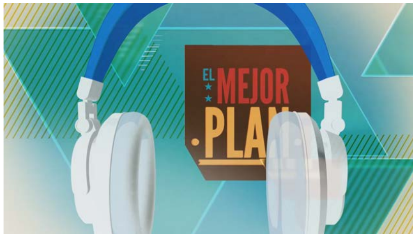
Diseño de apertura