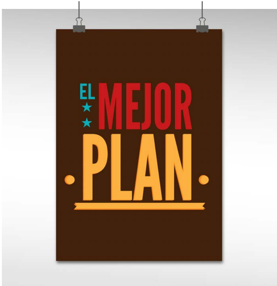
Logo El Mejor Plan