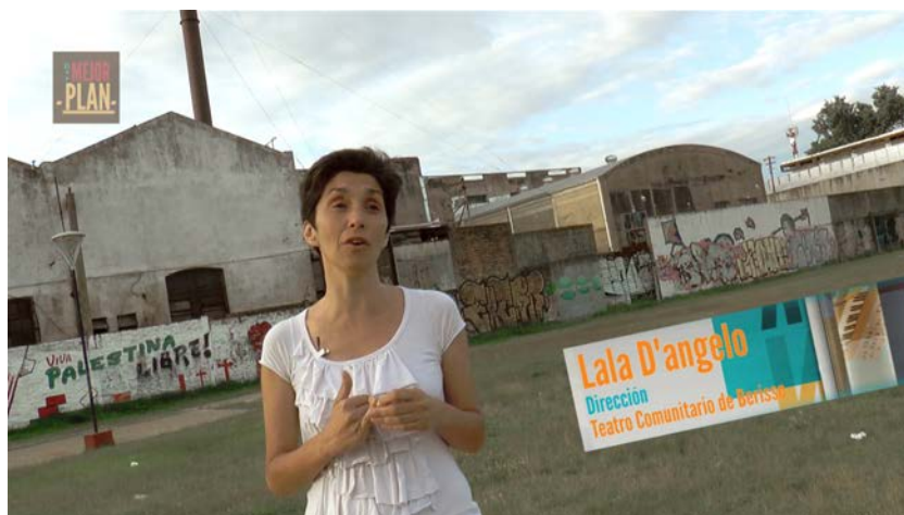
Zócalo en informe