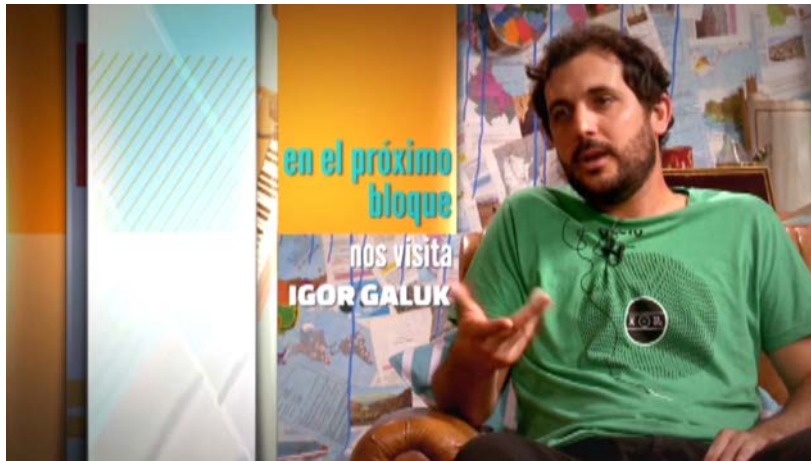
Separador de bloques