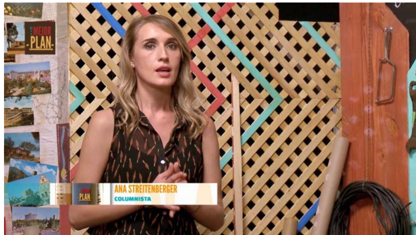
Zócalo en plano medio