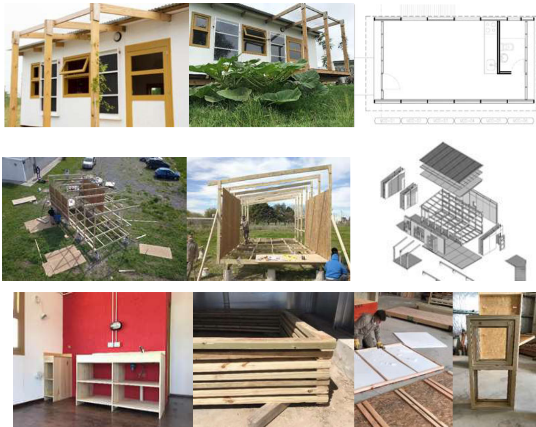
Figura 1: Solución Habitacional Modular, imágenes de la vivienda terminada, volumetría, etapas constructivas, mobiliario.

(f) Producción térmica: La calefacción es provista por calefactores solares de aire, livianos y el agua caliente con un calefón solar, todos pre armados en taller, instalados como componentes adicionales.