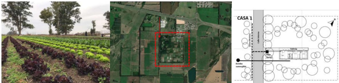
Figura 6. Colonia agro-ecológica en Lujan, prov. de Buenos Aires.