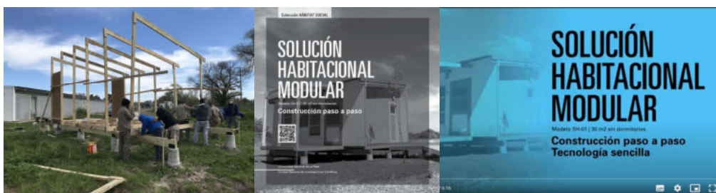
Figura 4: Manuales y videos. Construcción paso a paso. (Ver en referencias IIPAC).

Paso 8: Difusión del producto. Comunicación de los desarrollos en el ámbito académico, científico y social para la replicación de las experiencias en otros contextos.