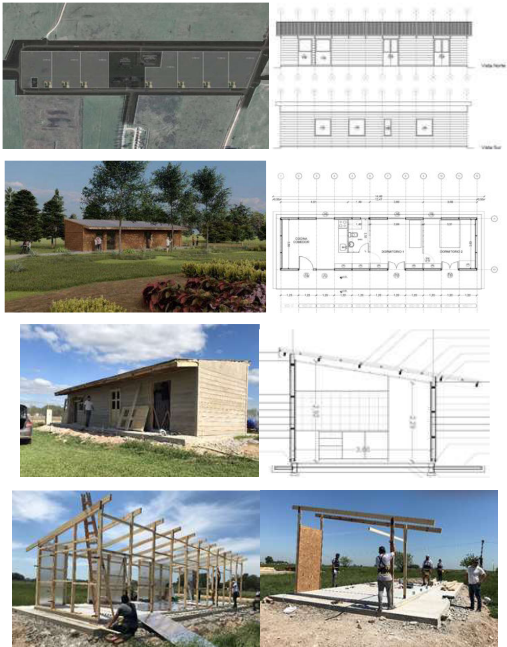
Figura 5. Colonia agroecológica en Tapalqué, prov. de Buenos Aires