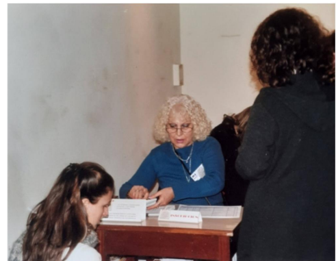
I Simposio Ictología de la Argentina: Biodiversidad y Biogeografía (SIABB), Auditorio del Museo de La Plata, 2005.