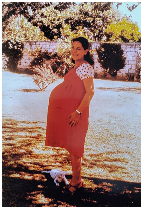
Octubre de 1976. Embarazo de su hijo Ariel.