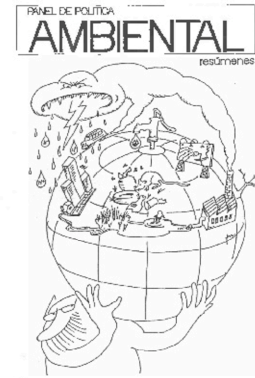
II reunión argentina de LIMNOLOGIA La Plata - 4 al 8 de noviembre de 1991