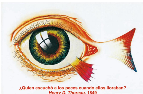
¿Quién escuchó a los peces cuando ellos lloraban? Henry D. Thoreau, 1849