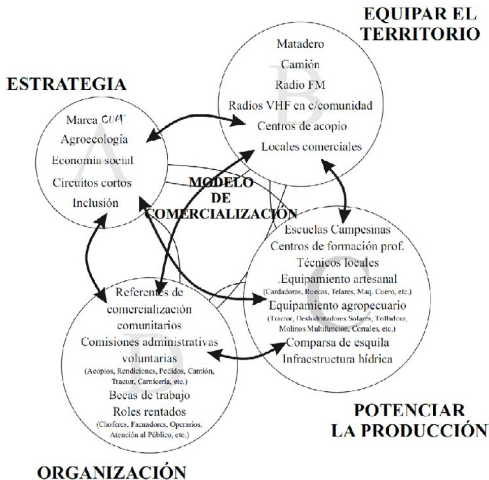
Ilustración 2 : Comercialización CUM. Elaboración propia

Desde el primer momento, tanto el equipo técnico, como los campesinos buscaron como estrategia de posicionamiento, la necesaria integralidad de comercializar todos los productos de la agricultura familiar, evitando ponderar unos sobre otra, situación que podría derivar en el abandono de alguna actividad en particular. Este es el ejemplo de los Artesanos del Colte, que han abandonados sus cultivos por la artesanía, traccionada por el turismo. Es decir los puntos de venta no solo buscaban la comercialización exclusivamente, sino la reivindicación de la agricultura andina como abastecedora de alimentos, prendas textiles, biodiversidad, etc. “LA CUM”, abrió dos puntos de venta de manera simultánea en el año 2017, tanto el local de productos artesanales, como el mercado de alimentos. Esto no fue casualidad, fue una estrategia política que buscaba evitar la mercantilización de una actividad en particular, sino todo lo contrario aportar a la economía familiar desde sus múltiples actividades.