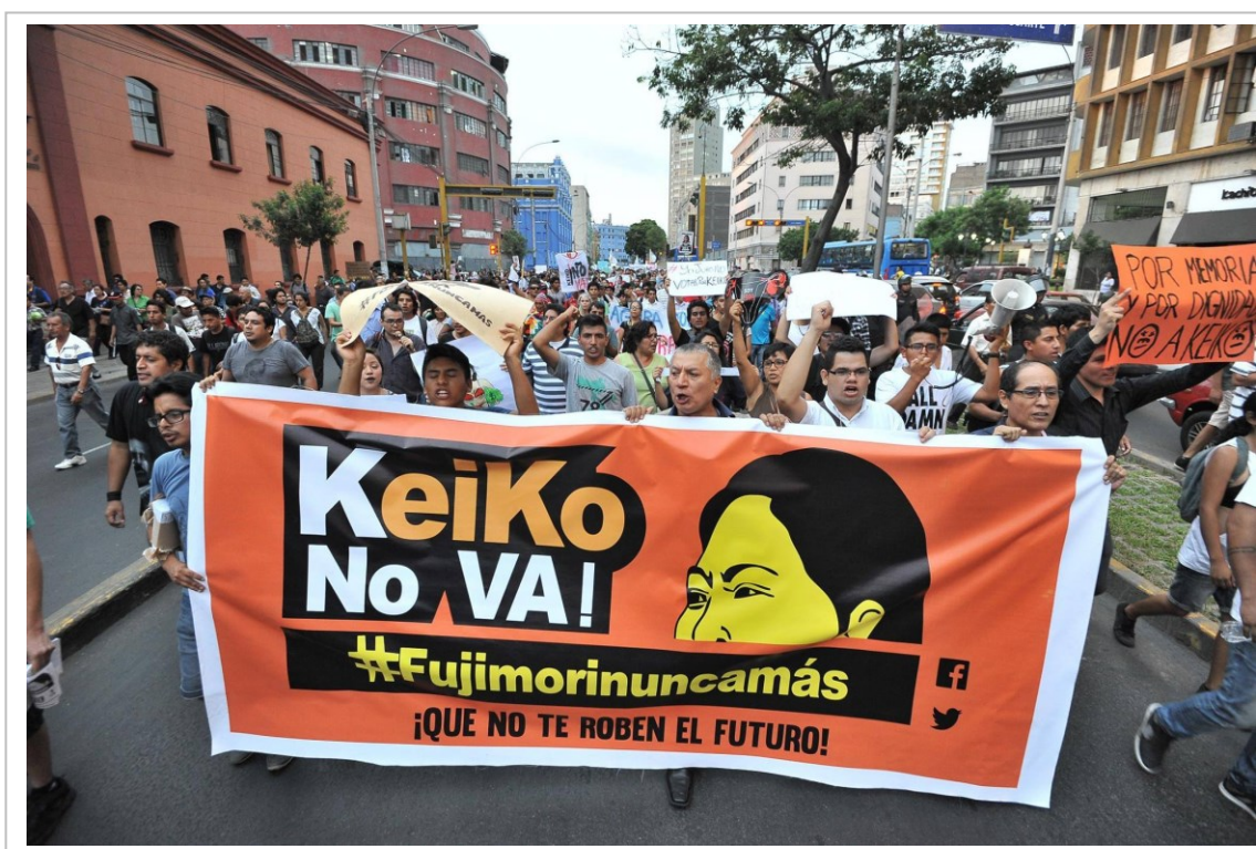
Figura 3. Pancarta con el lema «Keiko No Va!» utilizada en la marcha del 31 de mayo de 2016.

Los carteles con el nombre del colectivo «Keiko No Va» fueron el lema principal en la marchas. La expresión de rechazo total a la candidatura naranja se sintetizaba en estas tres palabras que significaban un no rotundo al pasado corrupto. Dicha frase se imprimió en pancartas, en afiches, y fue escrito de puño y letra en los carteles caseros que muchos de los/as participantes llevaron a la manifestación [Figura 3].