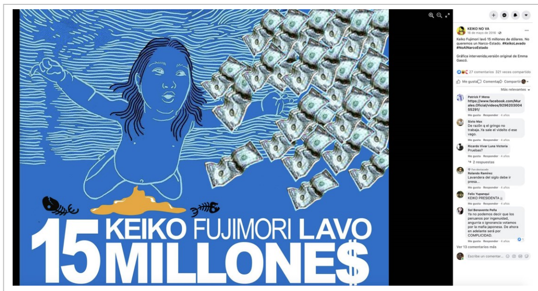
Figura 2. Publicación sobre el lavado de activos realizada por KNV en su fanpage de Facebook, el 16 de mayo de 2016.

Agotado el tema de memoria, Keiko No Va enfocó su comunicación en las distintas denuncias contra Keiko publicadas por los medios, entre ellas: la cercanía con el narcotráfico, las acusaciones de lavado de activos [Figura 2], los vínculos con la minería informal y la entrega de dadivas en campaña.