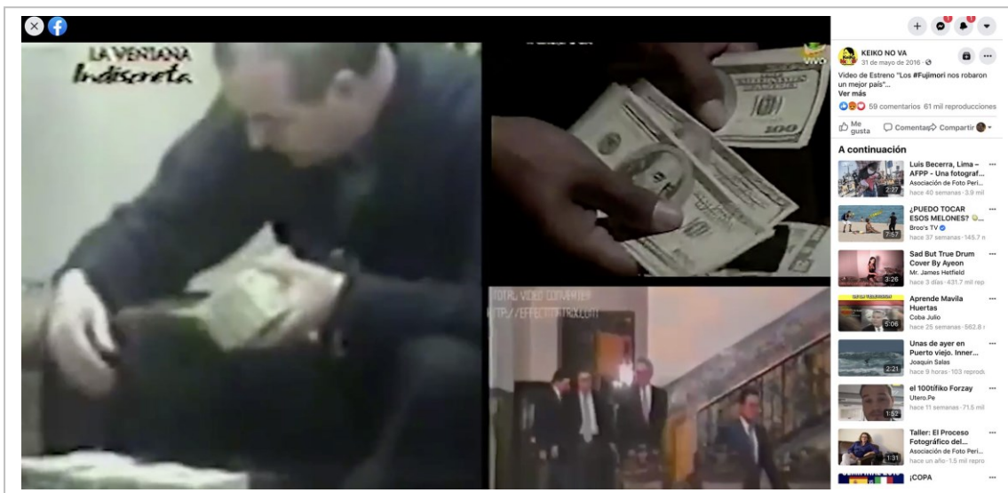
Figura 1. Publicación sobre casos de corrupción realizada por KNV en su fanpage de Facebook el 31 de mayo de 2016.

Entre los mensajes desarrollados respecto al tema memoria, podemos destacar cuatro: los casos de violación de derechos humanos, los casos de corrupción, el caso de esterilizaciones forzadas y el caso del autogolpe de 1992. De estos temas, seleccionamos una ejemplo que muestra el alcance logrado por el colectivo Keiko No Va en redes: la publicación «Los #Fujimori nos robaron el país» [Figura 1] que alcanzó las 61 mil reproducciones.