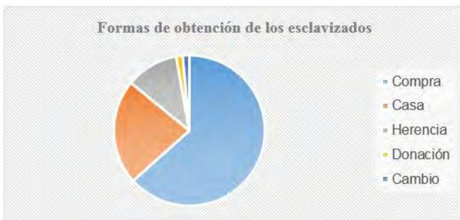
Elaboración propia. Fuente: AGPC. Expediente administrativo. Tomos 114, 115, 116, 117 y 118. Años 1853-1854.

En el 46,3% de los casos fueron obtenidos por la compra; en estos casos, los amos presentaban sus certificados de compra. En el 17,3% de los casos eran esclavizados que nacieron en el propio hogar del amo, por lo cual, los amos no solían contar con la documentación que testifique su posesión. Esa razón obligaba a los jueces a preguntar a los esclavos si sabían y conocían a sus amos, en estos casos, la palabra del esclavizado