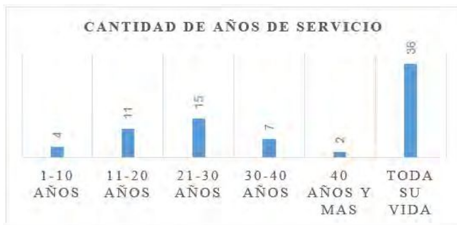
Elaboración propia en base a AGPC. Expedientes administrativos

Los registros de esclavatura y concesión de libertad no solo nos sirven para conocer quiénes eran los esclavos; sino, sobre todo, para dar cuenta de cómo los amos obtuvieron a estos esclavizados y conocer si tenían o no en su poder algún documento que certificara la propiedad. El gráfico 5 sistematiza las 5 formas de obtención de los esclavos: la compra, la herencia, el nacimiento en la propia casa, el cambio de esclavos y la donación.