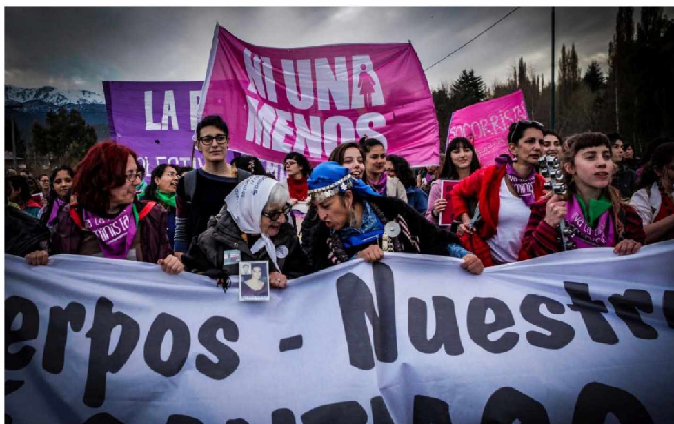
Figura 3. Colectivo Ni Una Menos, Nuestros cuerpos Nuestros territorios, Asamblea Ni Una Menos Bolsón. Marcha NUM. Mirta Baravalle, Madre de Plaza de Mayo Línea Fundadora (izquierda), Moira Millán, wichafer -guerrera- de las comunidades mapuches (derecha) (4/11/2017). http://niunamenos.org.ar/audiovisual/fotos/nuestros-cuerpos-nuestros-territorios-asamblea-ni-una-menos-bolson/