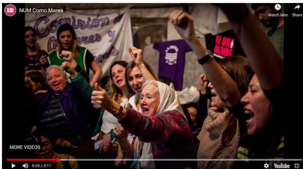
Figura 2. Colectivo Ni Una Menos. Asamblea multisectorial en el marco de NUM. [Video NUM Como Marea 0:32] (5/3/2018). http://niunamenos.org.ar/audiovisual/videos/num-como-marea/

Por otro lado, las imágenes respectivas a las figuras 2 y 3 dan visibilidad a una práctica interseccional, donde las sujetas que ponen el cuerpo y llevan la marcha adelante son plurales, multisectoriales y adoptan un sentido de comunidad y sororidad a pesar de pertenecer a diversas luchas. Tal es el caso de las Madres de Plaza de Mayo o las referentes de comunidades mapuches en la Patagonia.