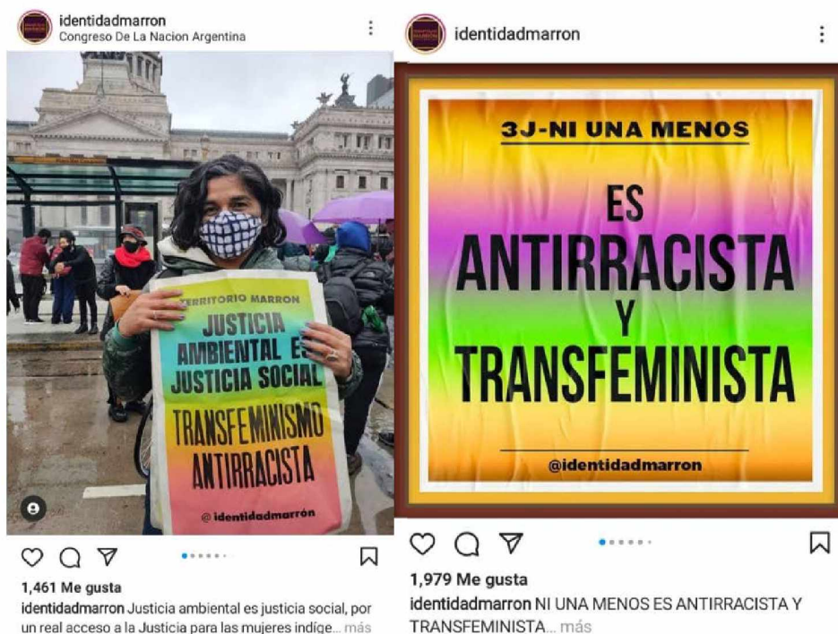
Figura 5. Identidad Marrón. Imágenes del perfil de Instagram del colectivo Identidad Marrón. A la izquierda publicación del 22 de mayo de 2021. A la derecha publicación del 3 de junio de 2021. @identidadmarron. https://www.instagram.com/p/CPdJktgz2W/?hl=es / https://www.instagram.com/p/CPML3xyALX-1/?hl=es

Un ejemplo de esto se puede observar en la figura 5, manifestación que llega desde el Instagram de Identidad Marrón (2021).