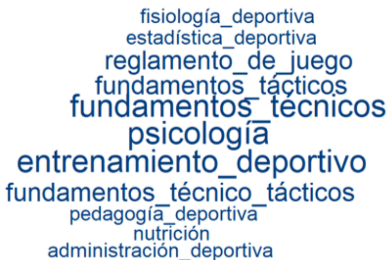
FIGURA 1 Nuvem de palavras das disciplinas de maior recorrência nos programas de formação

Para levantar a recorrência das disciplinas nos três cursos de formação utilizamos o software Iramuteq para a produção de uma nuvem de palavras. O programa constrói a nuvem a partir da recorrência dos termos que compõem o curpus textual, dessa forma, apresenta as palavras mais importantes com tamanho maior, centralizando-as na imagem, por outro lado, as palavras de menor recorrência são apresentadas com tamanho menor, assumindo as regiões periféricas da nuvem (Salviati, 2017). Devidamente alimentado pelas informações preparadas na fase de pré-análise, o programa construiu a nuvem conforme apresentado na Figura 1.