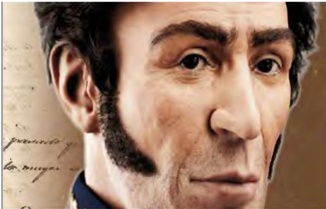
Foto: Portada de revista, colección unidad nuestra americana- comisión presidencial para la conmemoración del bicentenario de la carta de Jamaica, 2015

“En consecuencia, vale la pena intentarlo mantengamos vivo el sueño de unión de Bolívar” Andrés Manuel López Obrador 1