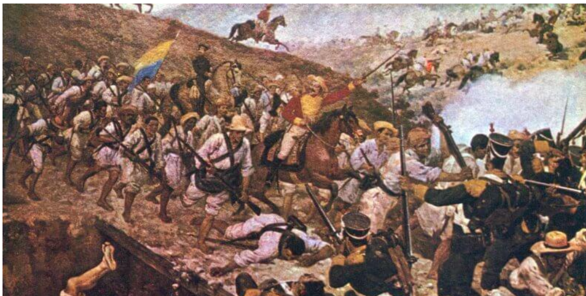
Tovar y Tovar, M. (1890). Batalla de Boyacá de 1819 . Palacio Federal. Caracas.

De sangre y llanto un río Se mira allí correr. En Bárbula no saben Las almas ni los ojos Si admiración o espanto Sentir o padecer. De Boyacá en los campos El genio de la gloria Con cada espiga un héroe Invicto coronó. La trompa victoriosa Que en Ayacucho truená,