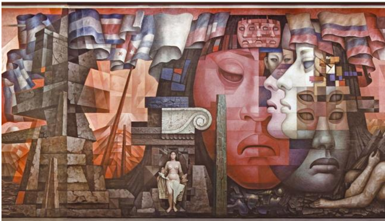
González Camarena, J. (1965). Presencia de América Latina . Casa de arte “José Clemente Orozco”. Universidad de Concepción. Chile.