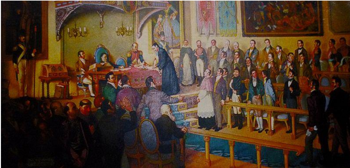
Vergara Ahumada, L. (s/d). Firma del acta de independencia centroamericana . Ex Casa Presidencial, San Jacinto. San Salvador. El Salvador.