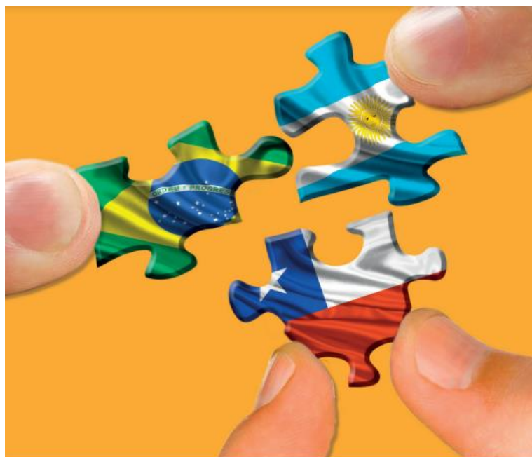
Portada Publicación: A 100 años del ABC: desafíos y proyecciones en el marco de la integración regional CESIM-IEI

Otro elemento que debemos plantearnos para la conformación del entendimiento de estos tres países es aquel que podemos denominarlo autopercepción de protección, que cabría vincularlo a generar una protección regional como producto de dos acontecimientos el primero lo evidencia el plano internacional es el conflicto de la primer guerra mundial o gran guerra y el segundo se inscribe dentro de un plano más regional el conflicto desatado entre EE.UU y México donde se visualiza una amenaza militar hacia un país que pertenece a la América Latina, este situación de enfrentamiento se inscribe dentro de los acontecimientos propios del devenir de la Revolución Mexicana.