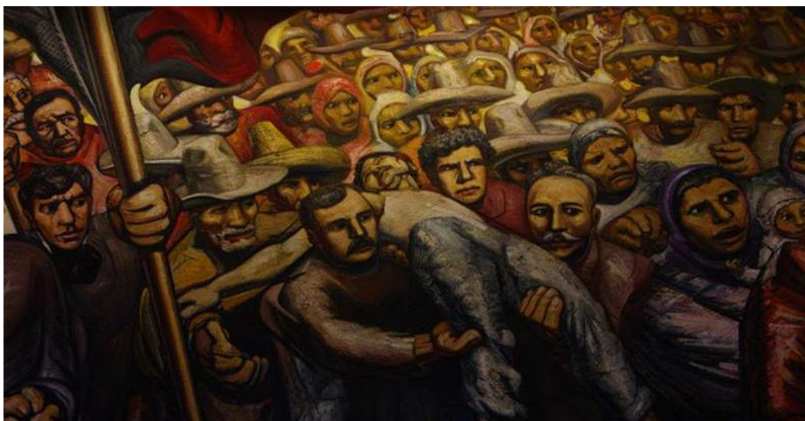
Sequeiros, D. (1966). Del porfirismo a la revolución . Castillo de Chapultepec, Ciudad de México, México.

mencionado- también expresan un posicionamiento contra el español, aunque algo menos intenso como enemigo común, y se encuentran comprendidos dentro de la construcción de los Estados-Nación como elementos legitimadores de identidad.