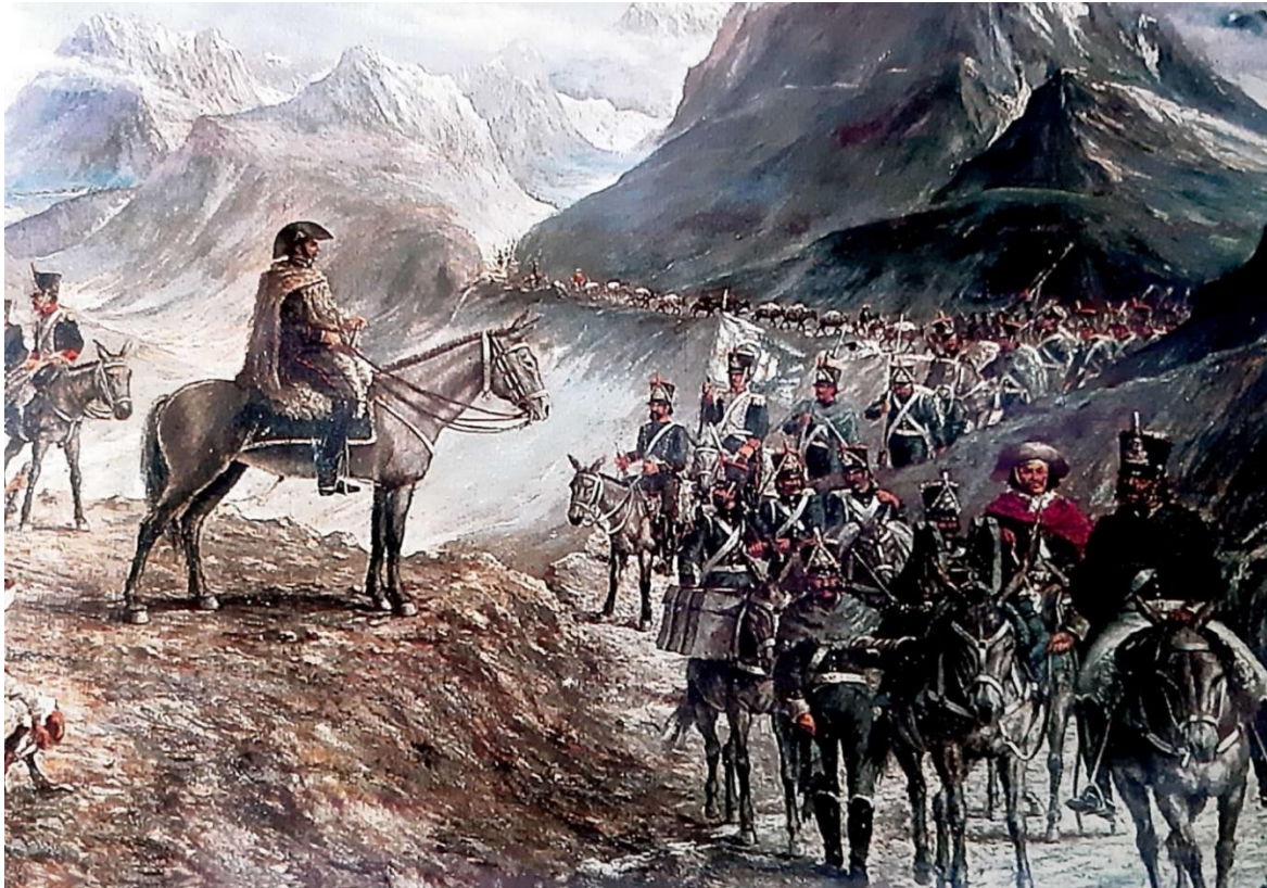
Van Riel, F. (1948). Paso de los Andes . Museo del Regimiento de Granaderos a Caballo. Buenos Aires