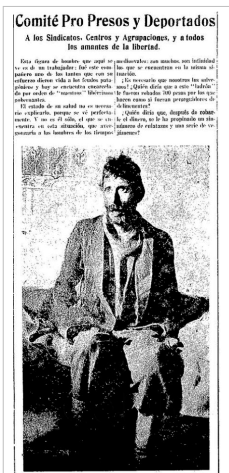
Figura 4. Información e imagen

Luego de terminada la huelga, La Protesta continuó publicando cartas de los huelguistas presos en las que denunciaban las duras condiciones de su encarcelamiento, así como los numerosos vejámenes, torturas y trabajos forzados a los que eran sometidos ( La Protesta , 24/04/1922). Otro tema denunciado con vehemencia por La Protesta fue el robo de ropas, dinero y otros elementos de los prisioneros por parte de la policía, la gendarmería y los soldados ( La Protesta , 20/05/1922) 20 [Figura 4].