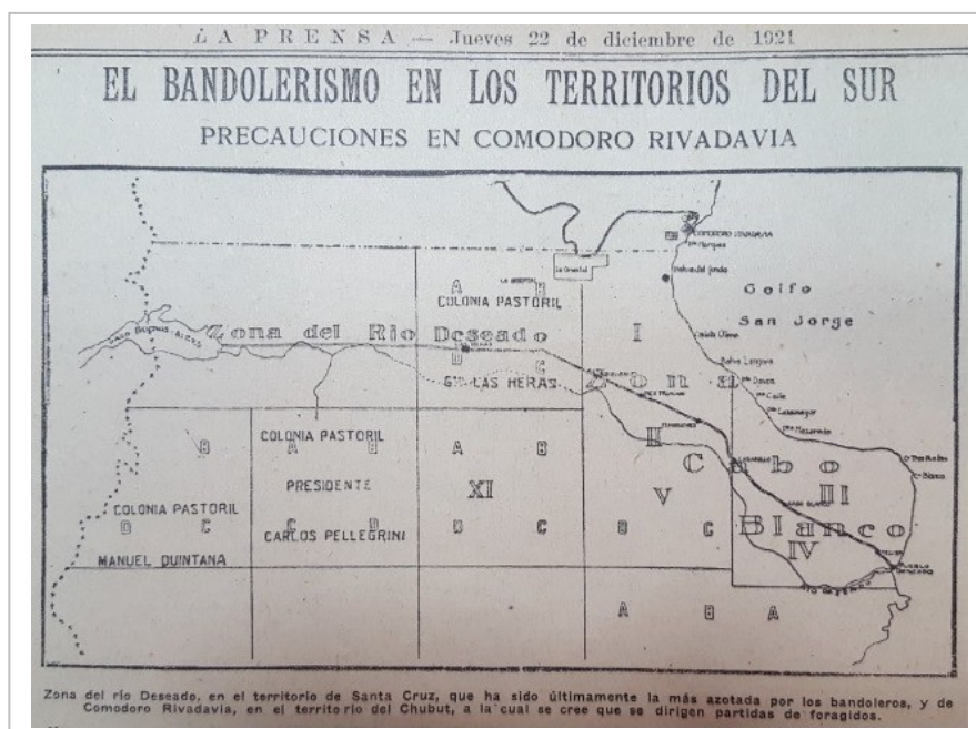
Figura 2. Plano del norte del territorio de Santa Cruz publicado en La Prensa el 22 de diciembre de 1921.

propias que penetraban en el territorio a lo largo de las vías férreas. En general, más allá de las críticas formuladas al gobierno, los diarios porteños reproducían las informaciones oficiales de forma acrítica, incluso en aquellos casos en los que se brindaban datos contradictorios. En este sentido, las críticas eran formuladas a la inacción previa y a las causas del conflicto, pero no a la resolución cuando el gobierno emprendió la vía armada para poner fin a la huelga rural.