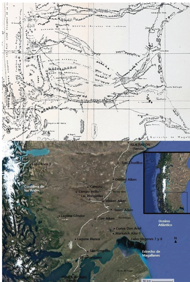
Figura 5. Ubicación de campamentos, paradores sobre estrecho de Magallanes y sitios arqueológicos. Superior: Moyano (1883); inferior: elaboración propia (2022)

largo de los cuales se realizaron actividades diversas, con artefactos de cronología muy reciente. Por otro lado, la permanencia en los campamentos del Shehuen —aún sin registro arqueológico— debió ser menor; probablemente, se trataba de un espacio de reunión de varios grupos en tránsito hacia el norte o el sur (Lista, 1880; Musters, [1871] 1964).