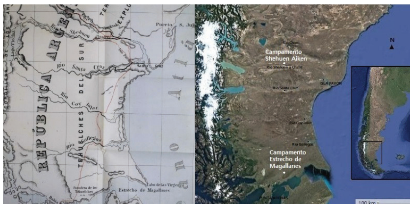
Figura 2. Ubicación de los principales campamentos tehuelches mencionados en las crónicas. Izquierda: Lista (1880); derecha: elaboración propia (2022)