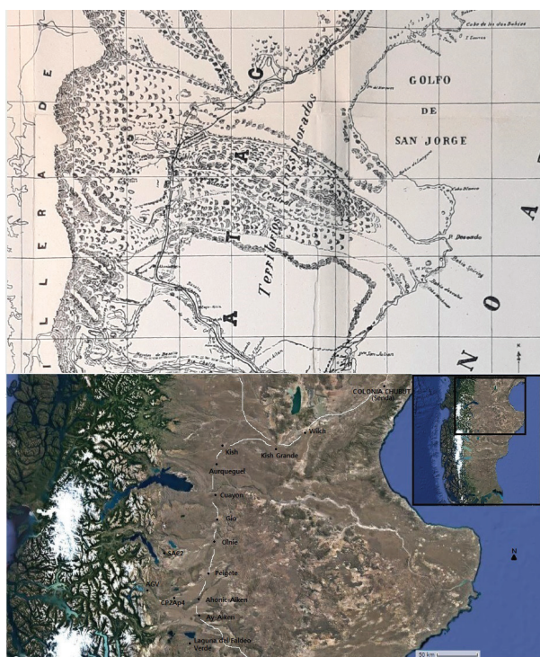
Figura 4. Ubicación de paraderos sobre el área cercana al valle del río Desierto y Senguer y sitios arqueológicos. Superior: Moyano (1880); inferior: elaboración propia (2022)

Además, este campamento se conectaba con las colonias nacionales asentadas en los ríos Chubut y Negro y con los grupos indígenas localizados al norte. Este espacio está documentado por Moyano (1881), quien junto a los indígenas Lara y Cachihuano exploraron el área entre los ríos Chubut y Santa Cruz a través de una senda de tránsito por el interior territorial (figura 4).