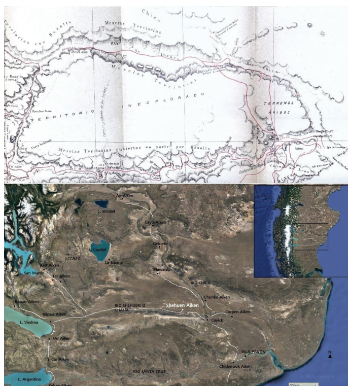
Figura 3. Ubicación de campamentos, paradores principales sobre el río Shehuen o Chico y sitios arqueológicos. Superior: Moreno (1879); inferior: elaboración propia (2022)

El río Shehuen o Chalía es angosto y su valle alcanza 8 km de ancho. Se encuentra rodeado de pasturas y mesetas elevadas conformando el límite sur del sector más árido bajo estudio. En su curso medio se asentaba el principal campamento tehuelche al norte del río Santa Cruz, rodeado de una serie de paradores satélites como así también de sendas indígenas (figura 3).