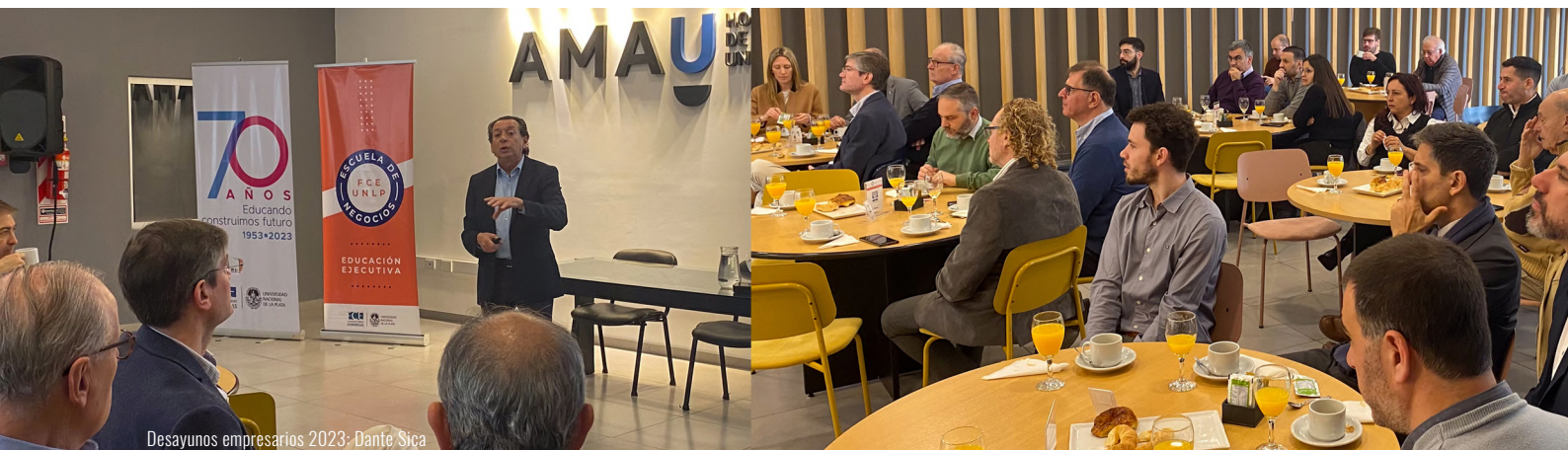
Desayunos empresarios 2023: Dante Sica