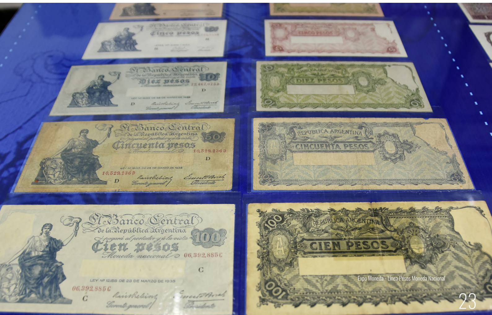
Expo Moneda - Línea Pesos Moneda Nacional

En suma, luego de nueve años, contamos a lo largo de este año con la apertura de tres procesos de categorización. Creemos que como resultado, contaremos con un plantel de docentes-