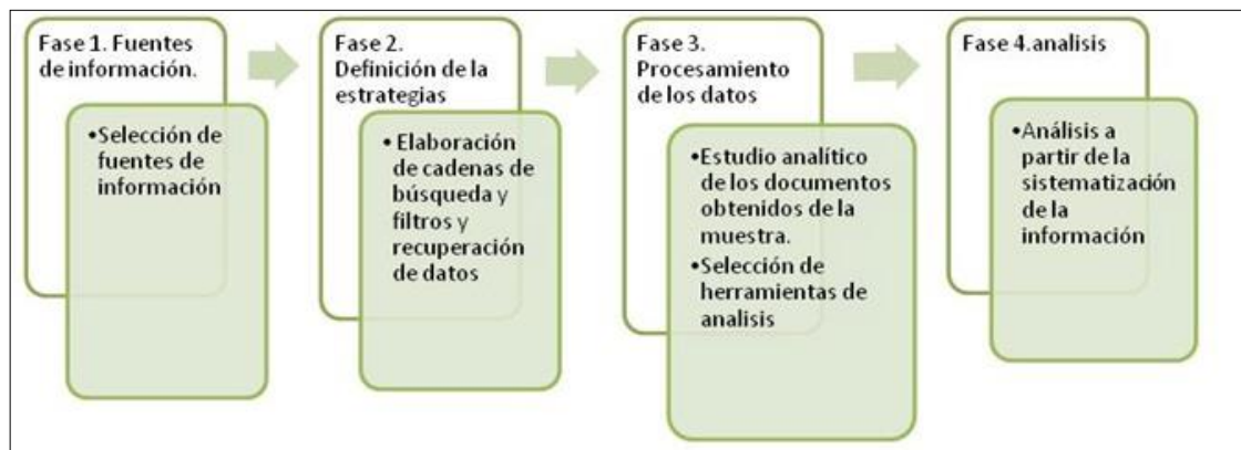
Figura 1. Fases del método implementado.

La praxis realizada para el logro de los objetivos se abordó en las siguientes fases (Figura 1):