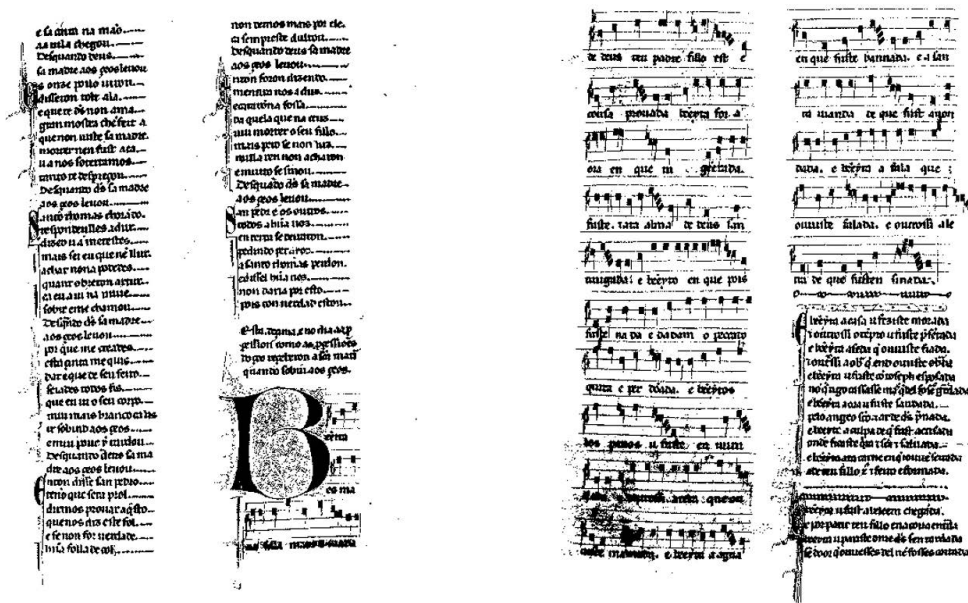
FIGURAS 1 Y 2. Folios 10v-11r (E).

No puede decirse que la CSM 420 ofrezca problemas de transmisión textual en el manuscrito E. Luego de la rúbrica inicial, y siguiendo el habitual método de copia de los códices con música, se copia la primera de las largas estrofas con notación melódica. A continuación, se transcribe solo el resto de las cinco coplas y la finda en una prolija gótica textualis que mantiene el tradicional uso de capitales adornadas y mayúsculas en color para el inicio de la estrofa. La separación de estas se remarca además con el trazado de una línea horizontal curva que recorre la columna, como puede verse en las Figuras 1-3.