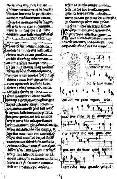
FIGURA 3. Folio 11v (E).