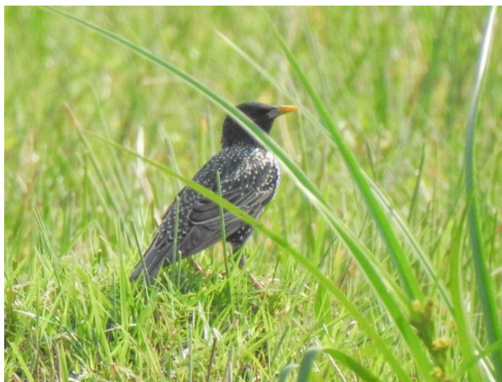
Figura 1. Estornino Pinto, Sturnus vulgaris , en Volendam, departamento de San Pedro, septiembre de 2021.

Aunque aún no existen registros ni indicios de nidificación en el país, consideramos que es vital prestar atención a su presencia en Paraguay, teniendo en cuenta que el Estornino Pinto es una especie invasora y dañina para los ecosistemas nativos (Linz et al. , 2007), además de un potencial reservorio y vector de agentes patógenos por sus hábitos gregarios y de desplazamiento (Cabe, 2021). Por ejemplo, en Argentina se han reportado daños a cultivos (Ibañez et al. , 2016b) y ocupación de nidos realizados por especies de aves nativas ( e.g. , Rizzo, 2010; Chimento, 2015; Ibañez et al. 2017).