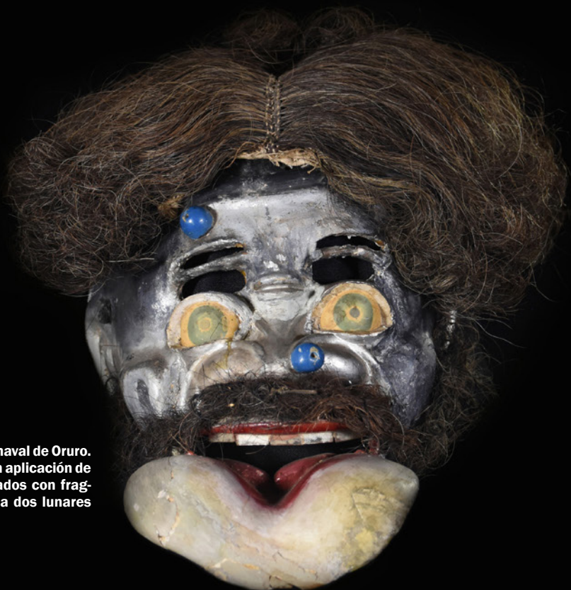
Bolivia - Oruro Collas Máscara de "Moreno" del carnaval de Oruro. Realizada en papel maché con aplicación de pelo natural y dientes realizados con fragmentos de espejos. Presenta dos lunares azules en el rostro. h: 28 cm a: 28 cm p: 30 cm