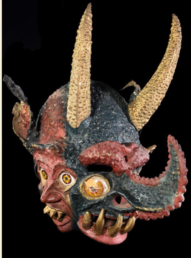
Bolivia- Oruro - Collas

Por otro lado, manifestando un profundo sincretismo religioso, los diablos representan a los corazones incautos de los humanos quienes al mando de Lucifer y Satanás, se consolidan como los seres portadores de los siete pecados capitales. Estos personajes danzan para venerar a la Virgen del Socavón. Realizan importantes fi-