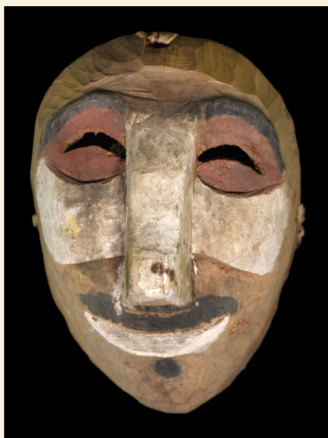
Argentina - Salta- Región Chaqueña - Chané Col. Enrique Palavecino, 1947 Máscara de carnaval, ñaña-ndechi o espíritu de anciano. h: 25 cm a: 17,5 cm

Al finalizar este encuentro festivo de danza, bebida y juegos en el que participa toda la comunidad, las máscaras deberán ser destruidas ya que están cargadas de un simbolismo del cual es necesario despojar-