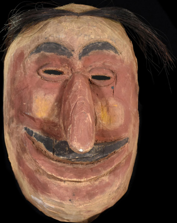
Argentina - Salta- Región Chaqueña - Chané Col. Enrique Palavecino, 1947 Máscara de carnaval, ña ndechi o espíritu de anciano. - h: 27 cm a: 17 cm