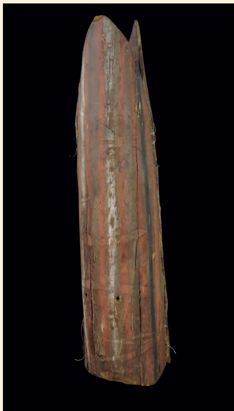
Argentina - Tierra del Fuego Yámana Donación P. Godoy, 1882 Máscara de madera polícroma. Utilizada en el ritual de iniciación a la adultez o Kina. h: 79 cm a: 62 cm

Esta máscara ritual es utilizada en ocasión del arete guasu , época del carnaval que comienza cuando aparecen las flores amarillas del taperigua, entre enero y febrero y se extiende por más de un mes, cuando comienzan a marchitarse. Esta es la única circunstancia en que los chané recurren al enmascaramiento, el cual permite diluir la barrera que separa la división entre el mundo de los vivos y el de los muertos. El enmascarado trasciende lo terrenal para adoptar los poderes y cualidades de estos últimos. Acompañada de un poncho, la máscara es el elemento donde se concentra el poder de representación, esencialmente el espíritu de los muertos y también de animales entre los que se cuentan el toro y el tigre, quienes deberán librar una lucha que simboliza el bien y el mal.