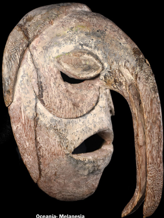
Oceanía- Melanesia Donación Francisco P. Moreno Máscara ritual de madera con decoración policroma. Presenta una característica nariz en forma de pico de pájaro. h: 29 cm a: 18 cm p: 16 cm