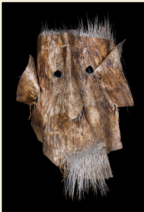
Brasil - Amazónicos Representación antropomorfa. Máscara ritual de cuero. - h: 25 cm a: 27 cm

Generalmente, la máscara etnográfica es un elemento cuya manifestación artística se integra a la vida mágico-religiosa, económica, política y social fortaleciendo así una identidad y un sentimiento de pertenencia que atraviesa generaciones. Las hay antropomorfas y zoomorfas, pudiendo variar entre el estilo realista hasta el más figurativo. En la riqueza de materiales y su combinación se develan el temor, la muerte, la burla o la risa, asociadas a ámbitos tan diversos como el teatro, la guerra, enterratorios, fiestas, sociedades secretas y ritos de pasaje e iniciación.