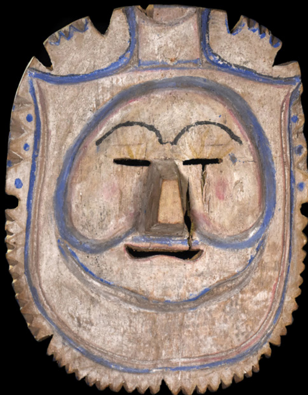
Argentina - Salta- Región Chaqueña Chané Col. Enrique Palavecino, 1947 Máscara de carnaval, antropomorfa con contornos aserrados. - h: 35 cm a: 27 cm