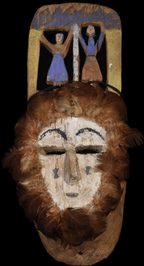
Argentina - Salta- Región Chaqueña- Chané Col. Enrique Palavecino, 1947 Máscara de carnaval, haña hanti o espíritu de joven. El hanti presenta tres figuras humanas caladas y pintadas. Presenta el rostro cubierto de pintura blanca y contorno con plumas. h: 19 cm a: 13 cm