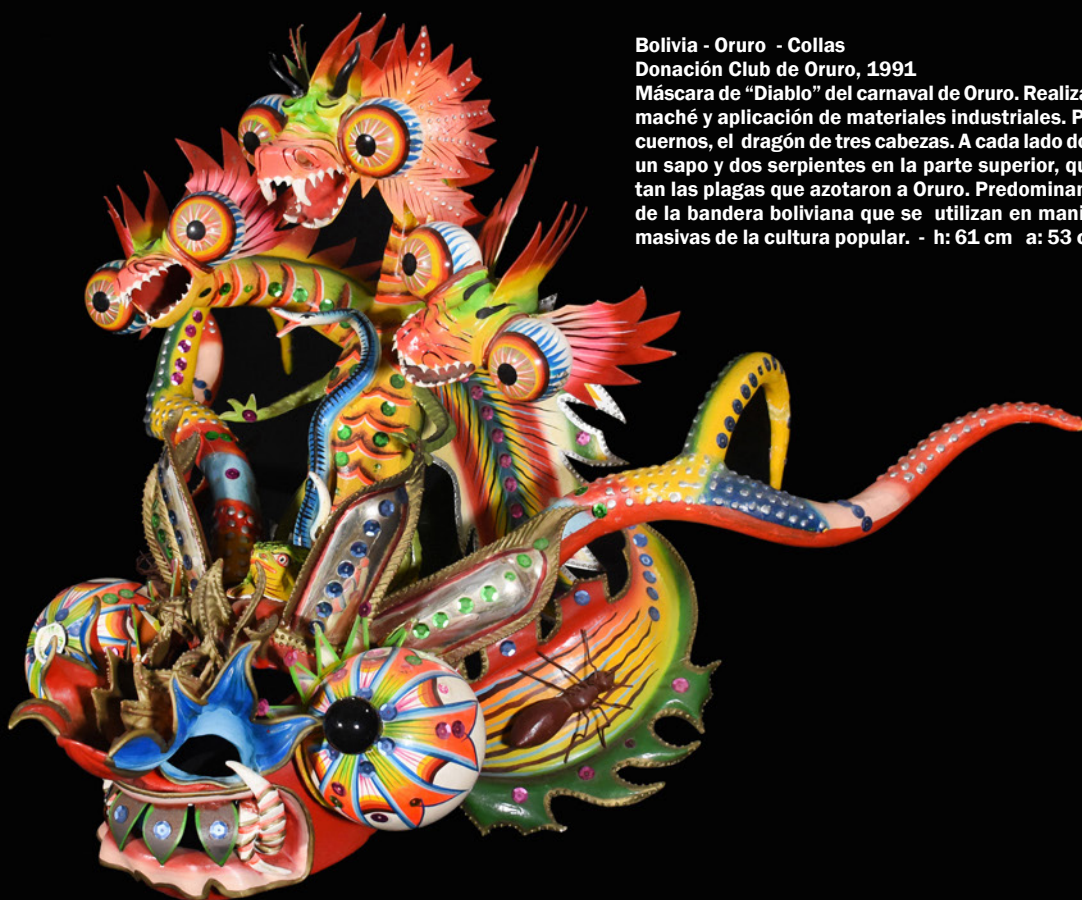
Bolivia - Oruro - Collas Donación Club de Oruro, 1991 Máscara de "Diablo" del carnaval de Oruro. Realizada en papel maché y aplicación de materiales industriales. Presenta dos cuernos, el dragón de tres cabezas. A cada lado dos hormigas, un sapo y dos serpientes en la parte superior, que represen- tan las plagas que azotaron a Oruro. Predominan los colores de la bandera boliviana que se utilizan en manifestaciones masivas de la cultura popular. - h: 61 cm a: 53 cm p: 53 cm