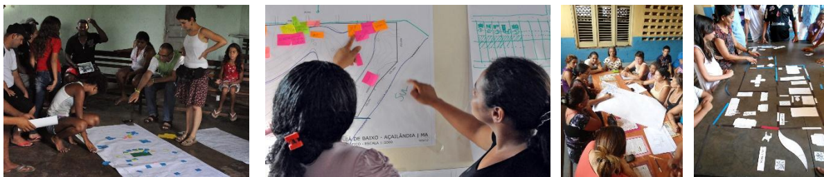
FIGURAS 9, 10, 11 Y 12: Discusión del proyecto participativo en Piquiá de Baixo. 9 y 10, distintas escalas del barrio; 11 y 12, de la vivienda.

Aún en esta fase, se realizaron actividades para reflexionar colectivamente sobre el espacio de la vivienda. Los cuatro grupos se subdividieron en hombres, mujeres, jóvenes y ancianos; cada uno de estos subgrupos debatiría sobre el uso que le dan a cada espacio de la vivienda y propondría cómo sería el diseño de cada área a partir de los usos y necesidades de los integrantes de la comunidad. En este contexto, las mujeres representaron la mayor parte de la población, y el debate sobre la división sexual del trabajo, la vivienda y la reproducción de la vida estuvo influido por el género, la raza y la clase. Destacaron que la cocina es el espacio principal de la casa y que los lugares donde se realizan las tareas reproductivas deben priorizarse de acuerdo con su funcionalidad (Soto Villagrán, 2016). Después de planear las directrices para la construcción de cada habitación de la casa, el siguiente paso fue discutir y proponer, con base en los muebles impresos a escala 1:10, cómo se podrían organizar estos espacios y registrar (aún sin las paredes) las ideas que surgían en los grupos (Figuras 11 y 12).