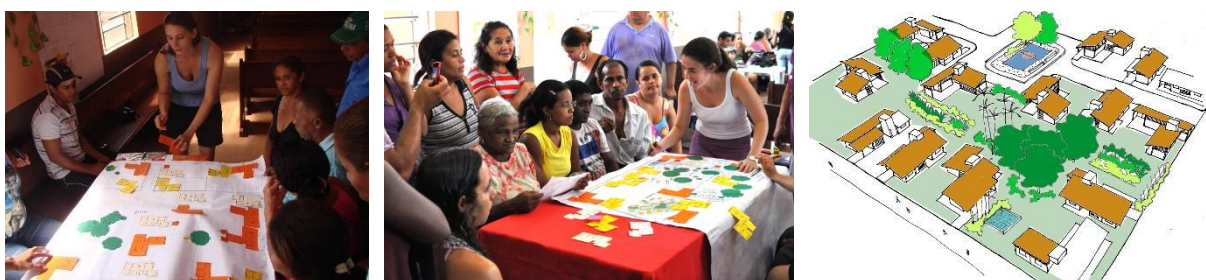
FIGURAS 13, 14 Y 15: Proyecto participativo en la escala de la cuadra y esquema (dibujo) de los patios.

En este sentido, en la fase de diseño creció la cohesión social y política. Mariana Enet (2012, p. 206) afirma que “un colectivo que vivencia un proceso participativo en forma efectiva ya nunca es el mismo, pues ha adquirido capacidades para pensar y actuar en forma diferente a la pasividad del sistema dominante y vuelve a confiar en el valor de sus propios conocimientos y habilidades”. Es el momento en el que más se ejerce la producción del espacio regida por la lógica del uso. Las decisiones sobre la forma del espacio no estaban separadas de la concreción de las relaciones que se establecían en el seno de la comunidad, que a su vez constituyeron la capacidad productiva colectiva (Lefebvre, 1974). En estas decisiones están inmersos los enfrentamientos con el capital, pues se niega colectivamente el proyecto estándar, es decir, el lote y la casa con extensiones mínimas, así como la monofuncionalidad del conjunto habitacional, entre otros elementos.