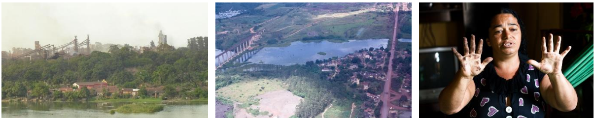
FIGURAS 1, 2 Y 3: Piquiá de Baixo y las industrias al fondo; foto aérea de Piquiá, la ruta y el ferrocarril a la izquierda; habitante de Piquiá con las manos cubiertas con polvo de hierro