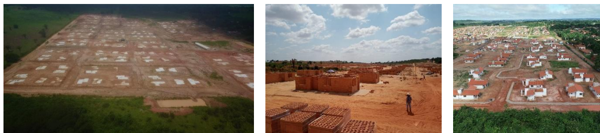
FIGURAS 19, 20 Y 21: Cantero de obras y cimientos terminados (2019); cantero de obras (2020), y en marzo de 2023, una imagen de la obra tomada con un dron.

manzanas estaban garantizados. Con la forma urbana consolidada, la forma política autogestiva ya no era necesaria. Nos preguntamos, aún sin respuesta, en qué medida el potencial emancipador del proyecto generó restricciones que limitaron las actividades de la obra.