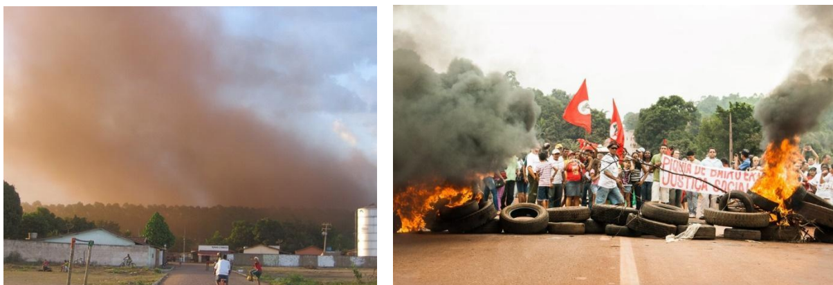
FIGURAS 7 Y 8: Polución en el barrio de Piquiá y manifestación por el reasentamiento de la comunidad en la ruta BR 222.

En medio de flagrantes violaciones a los derechos humanos y de manifestaciones, parte fundamental del repertorio de las luchas de la comunidad (Figuras 7 y 8), la empresa minera Vale S. A. ofreció un proyecto para reasentar las familias. Sin embargo, al darse cuenta de que no tendrían derecho a elegir el lugar, ni las características de la vivienda y el barrio, la población decidió luchar por su propio proyecto, con una asesoría técnica autónoma. En 2012, Justiça nos Trilhos invitó a Usina a participar en el proceso de selección para el proyecto de reasentamiento de Piquiá de Baixo, junto con otras asesorías de Brasil.