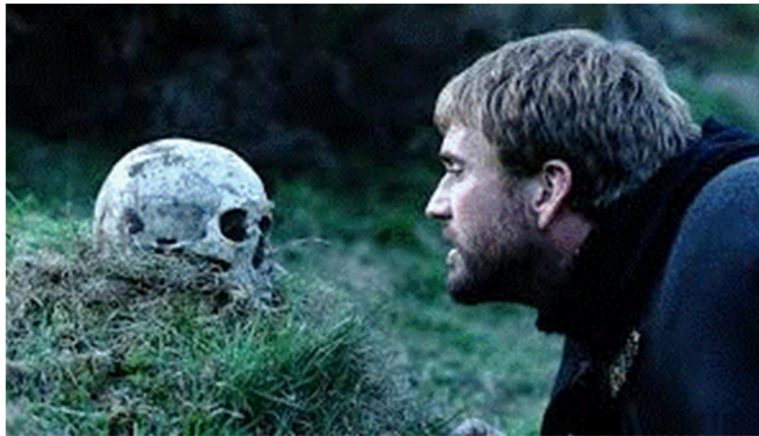
Figura 5.1. Hamlet y sus conflictos 1

Nota. Reproducido de Hamlet, de Zeffirelli M. (1990). Fotograma de la película. EE.UU.-U.K.-Francia: IconProductions y otros.