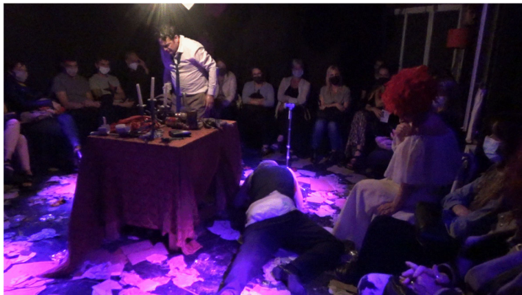
Figura 4.1. El evento teatral