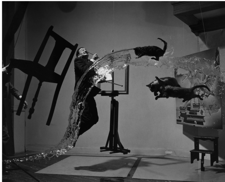
Figura 3.1. Arte fotográfico.

Nota. Reproducido de Atomicus Dalí , de Halsman P. (1948). Fotografía artística , Nueva York.