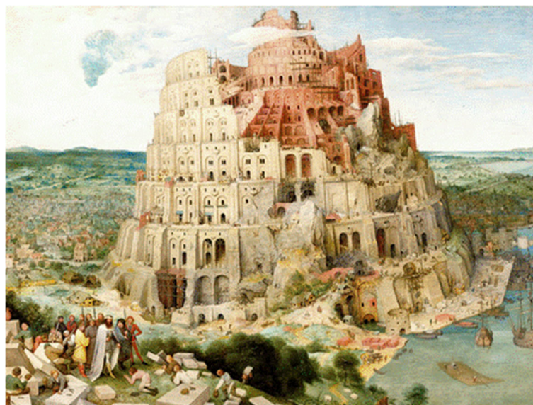
Nota. La torre de Babel, de Brueghel P. (1563). Pintura al óleo sobre tabla. Viena: Museo de Historia del Arte.

Al decidirnos estudiar Arte, por ejemplo música o plástica, sabemos que esto significa que vamos a formarnos en una carrera y, más importante aún, que vamos intentar emprender el camino para convertirnos en profesionales.