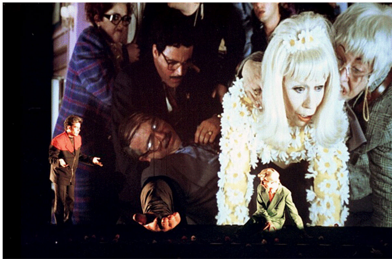
Figura 3.4. Cine dentro del teatro 1

Nota. Reproducido de Cegada de amor, de Milán Jordi y otros (1994). Fotografía del espectáculo teatral-cinematográfico. Barcelona: Compañía teatral La Cubana.