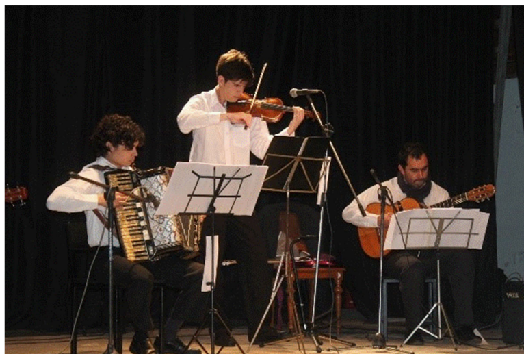
Figura 2.2. En concierto.