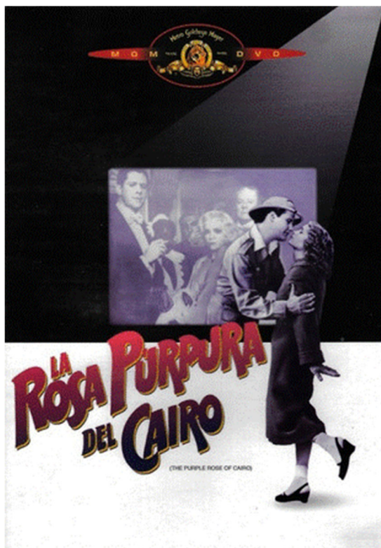
Figura 3.3. Cine dentro del cine.

Nota. Reproducido de La rosa púrpura del Cairo, de Allen W. (1985). Afiche de la película, EE.UU.: OrionPictures.