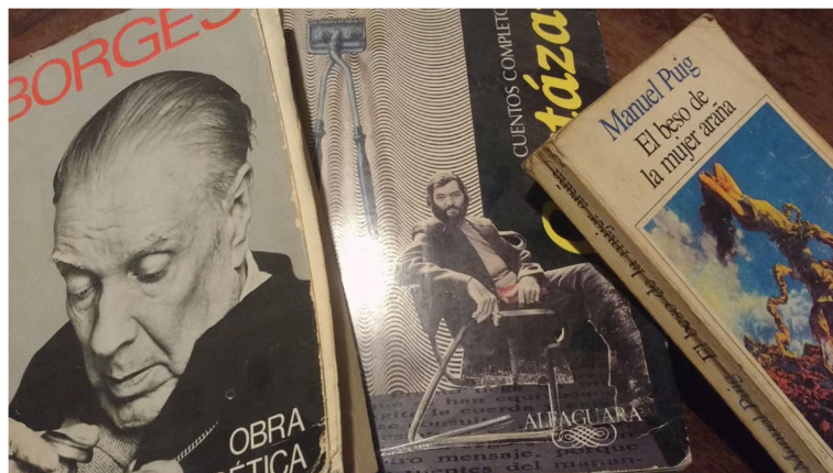
Figura 2.1. Literatura argentina.