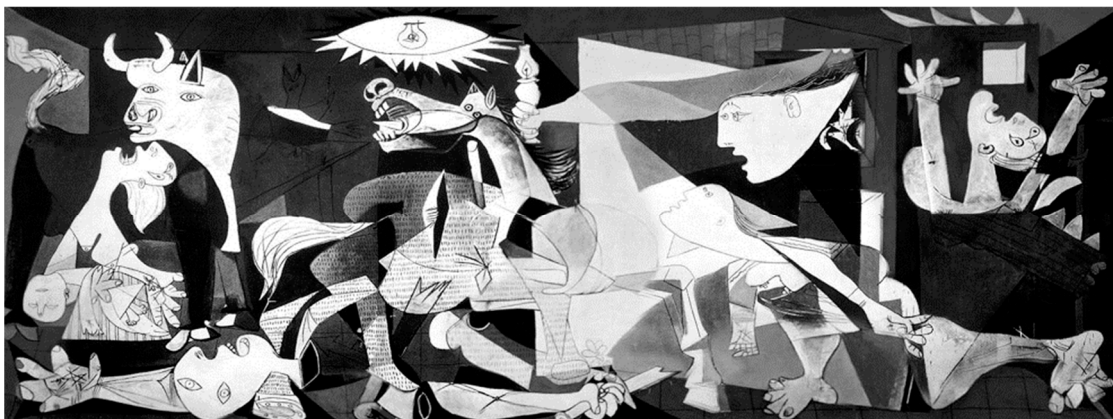
Figura 2.4. Pintura contemporánea.

Nota. Reproducido de Guernica , Picasso P., París (1937). Pintura al óleo sobre lienzo. Madrid: Museo Reina Sofía.