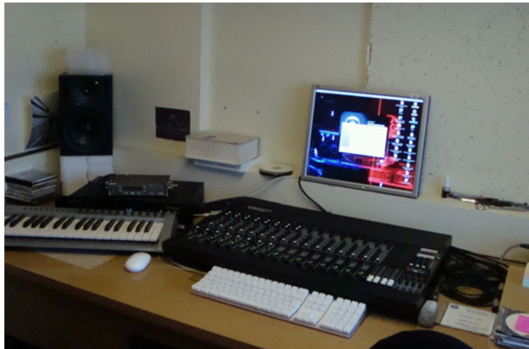
Figura 6.1. El taller del músico