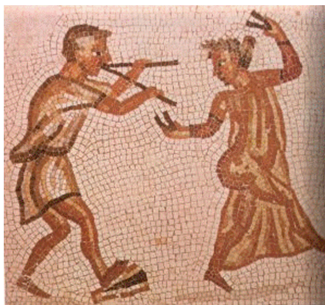
Figura 0.1. Música y danza en la Roma antigua.

Nota. Danza de comedia romana, Anónimo (Siglo III d.C.). Fotografía de mosaico del Aventino. Ciudad del Vaticano: Museo Pio Clementino.