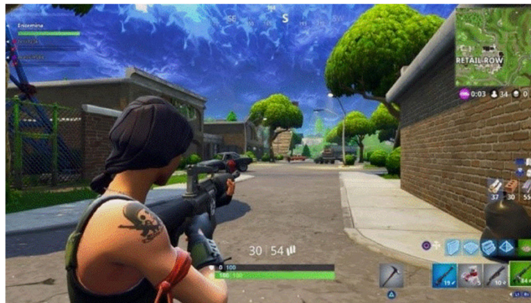
Figura 3.6. Avatar dentro de un entorno virtual.

Nota. Reproducido de Fortnite, Holmes E. (2017). Fotograma del videojuego. EE.UU.: EpicGames.