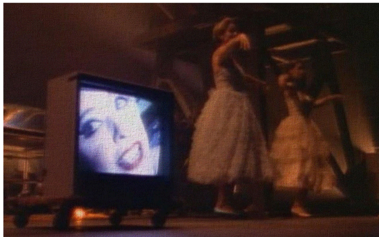
Figura 7.1. Montaje escénico

Nota. Reproducido de Industrial Symphony No. 1, de Lynch D. (1990). Fotograma del teatro musical en VHS., EE.UU.: Warner.