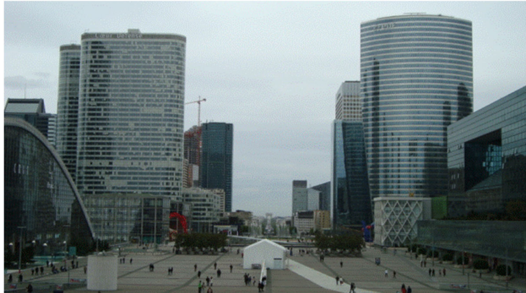
Figura 2.5. El barrio de la défence de París.