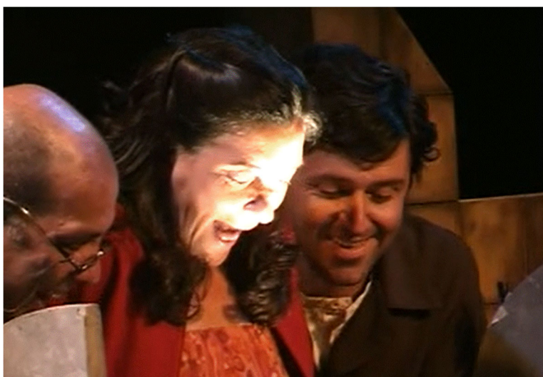
Figura 2.6. Personajes en escena.