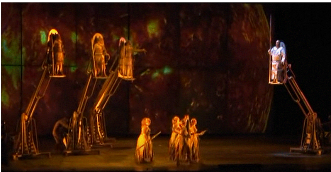
Figura 0.2. Arte total.

Nota. La Valquiria, de Richard Wagner (1970). Fotografía de la versión escénica de la compañía teatral española La fura dels baus (2007). Valencia: Palau de Les Arts Reina Sofía.