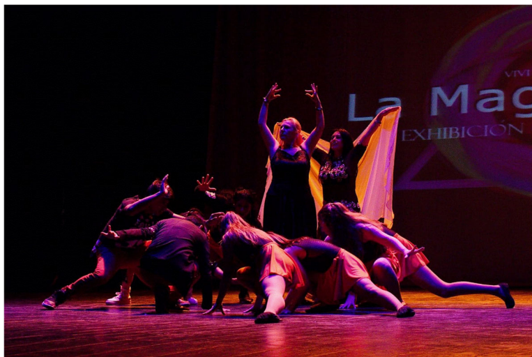
Figura 2.3. Danza en escena.