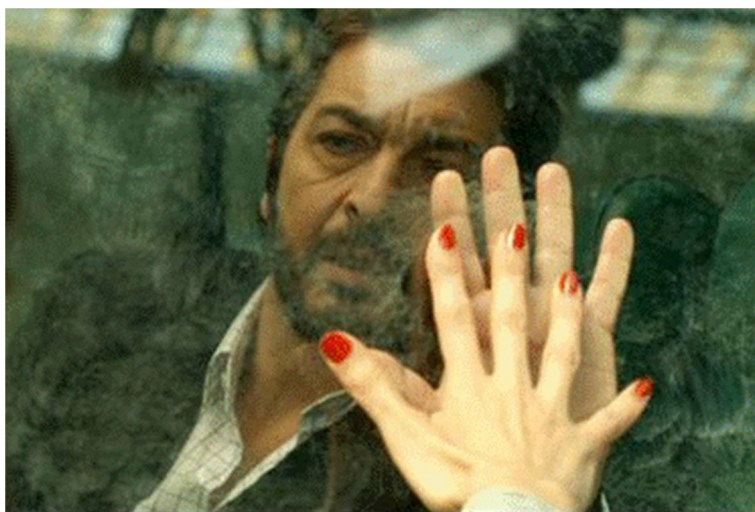
Figura 3.2. Personajes en función cinematográfica.

Nota. Reproducido de El secreto de sus ojos, de Campanella J. J. (2009). Fotograma de la película. Argentina-España: Haddock Films y otros.